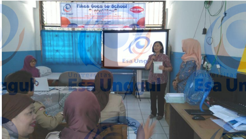
Gambar 3: Penyuluhan pencatatan identifikasi kesehatan dan rekam kesehatan personal siswa