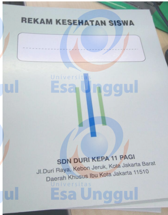
Gambar 1: Buku Rekam Kesehatan Personal Siswa