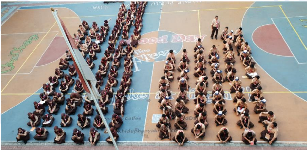
Lampiran 5. Foto Kegiatan Siswa