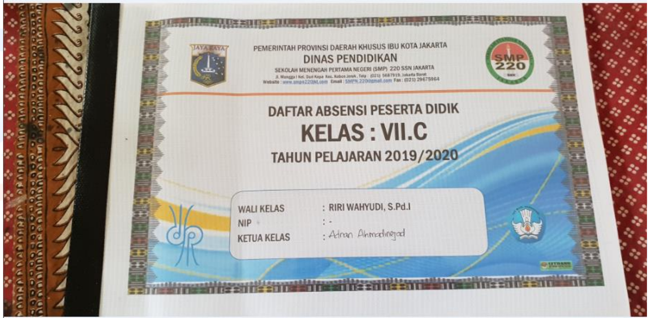
Lampiran 4. Foto Absensi