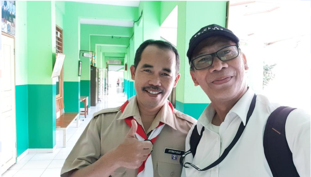
Gambar 1. Foto bersama staf pengajar