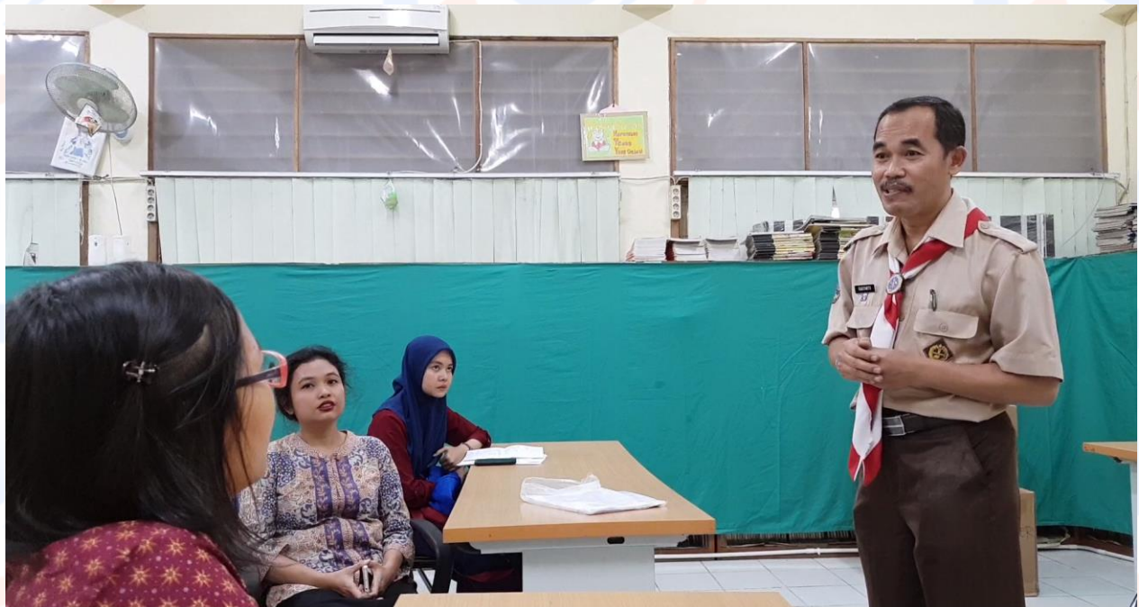
Gambar 2. Foto Staf Pengajar