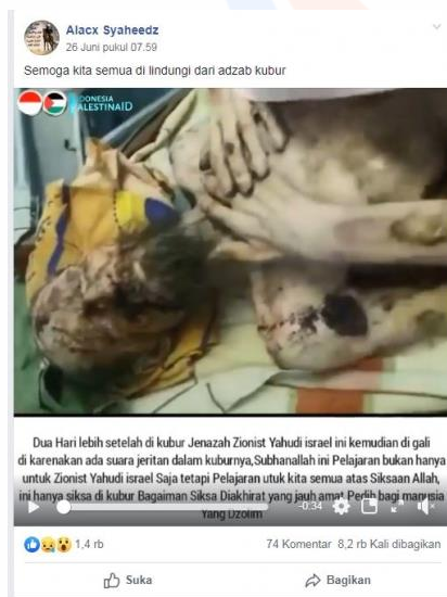
Gambar 2. Contoh berita hoax 1

(whatsapp - https://israelst21.blogspot.com/2019/06/cek-fakta-beredar-video-pria-israel.html )