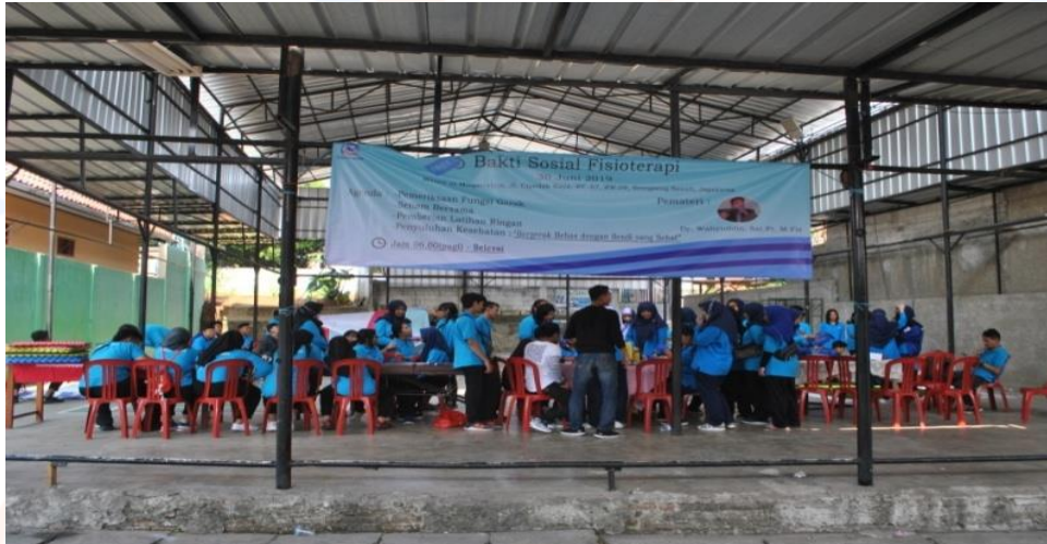
Keterangan Gambar : Suasana lokasi kegiatan di depan Masjid Al-Muqorrobin, Jl. Cipedak Raya, RT. 07, RW. 09, SrengsengSawah, Jagakarsa.

Hasil yang dicapai dalam kegiatan ini adalah menscreening gangguan gerak dan fungsi serta status kesehatan masyarakat di kawasan sekitar Masjid Al-Muqorrobin, Jl. Cipedak Raya, RT.07, RW.09, Cipedak-Srengseng Sawah, Jagakarsa. Adapun hasil pelaksanaan kegiatan tersebut dapat dilihat pada gambar di bawah ini: