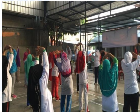
Keterangan Gambar : Senam pagi bersama ibu-ibu yang tinggal di sekitar Masjid Al-Muqorrobin, panitia, dan peserta yang merupakan salah satu dari rangkaian acara “Fisiologi 2019”