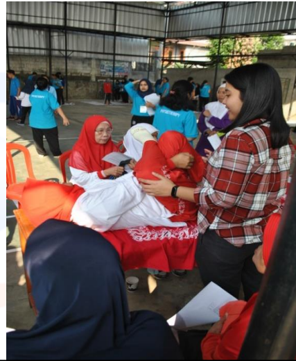
Keterangan Gambar : Pemeriksaan oleh Staff Klinik Fisioterapi Esa Unggul terhadap warga yang memiliki keluhan terkait sendi saat melakukan aktivitas sehari-hari.