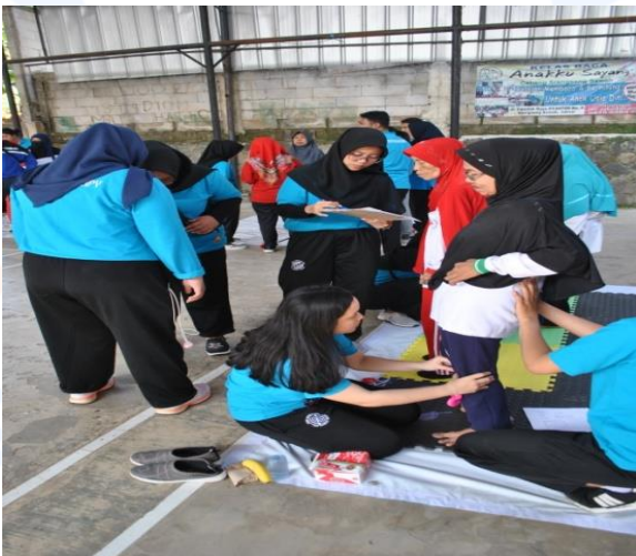
Keterangan Gambar : Pemeriksaan alignment sendi yang dilakukan oleh mahasiswa/i fisioterapi Esa Unggul terhadap warga di sekitar lokasi acara.