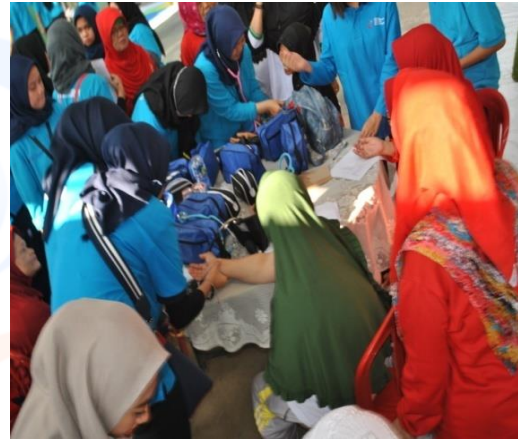
Keterangan Gambar : Suasana saat mahasiswa/i fisioterapi Esa Unggul melakukan pemeriksaan vital sign terhadap warga di sekitar lokasi acara.