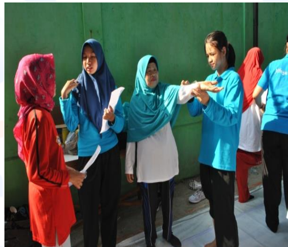
Keterangan Gambar : Pemeriksaan ROM (Range of Motion) yang dilakukan oleh mahasiswa/i fisioterapi Esa Unggul terhadap warga di sekitar lokasi acara.