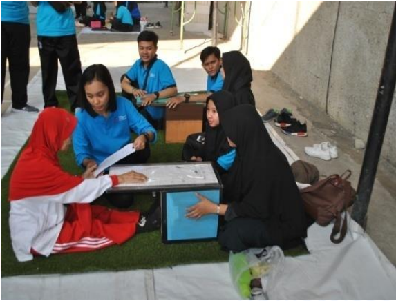
Keterangan Gambar : Pemeriksaan fleksibilitas otot yang dilakukan oleh mahasiswa/i fisioterapi Esa Unggul terhadap warga di sekitar lokasi acara.