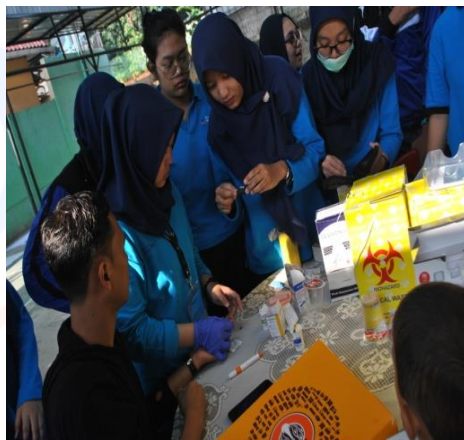
Keterangan Gambar : Suasana saat mahasiswa/i fisioterapi Esa Unggul melakukan pemeriksaan gula darah terhadap warga di sekitar lokasi acara.