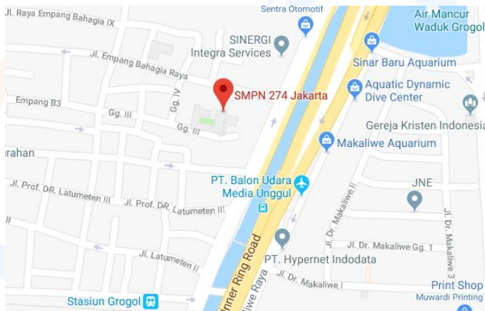
Gambar 1: Peta lokasi SMPN 274 Jakarta

Sekolah ini memiliki 30 orang guru. Rombongan belajar untuk kelas 7 ada 6 kelas. Hal yang sama terjadi juga di kelas 8. Kelas 9 memiliki 5 rombongan belajar. Peta lokasi SMPN 274 Jakarta adalah sebagai berikut.