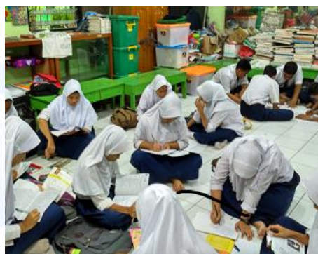
Gambar 2: Kegiatan literasi di SMPN 274 Jakarta

Di SMPN 274 Jakarta, gerakan literasi dilakukan setiap Senin setelah upacara bendera dan Selasa (diintegrasikan dengan pelajaran lain). Kegiatan ini sudah berlangsung selama 4 tahun. Bahan bacaan disediakan oleh sekolah. Setelah membaca, siswa diminta untuk merangkum bahan bacaan. SMPN 274 memiliki tim khusus yang mengelola gerakan literasi sekolah. Tim tersebut beranggotakan beberapa orang guru. Literasi yang dilakukan hanyalah membaca teks. Siswa mempunyai jurnal literasi. Setelah membaca, siswa menuliskan ringkasan dan kesan terhadap bacaan dalam jurnal. Target yang ditetapkan sekolah siswa dapat menyelesaikan 1 buku selama 1 semester. Siswa cenderung bosan dan mengerjakan hal lain seperti tugas mata pelajaran lain selama jam literasi.