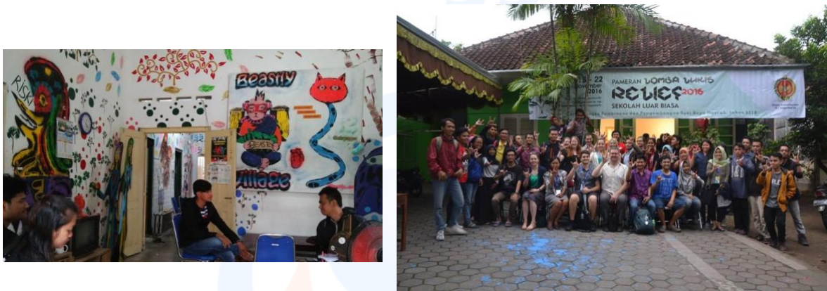
Gambar 4. Foto Kegiatan di DAC Yogyakarta