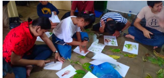
Gambar 3. Foto kegiatan sosialisasi di DAC Yogyakarta