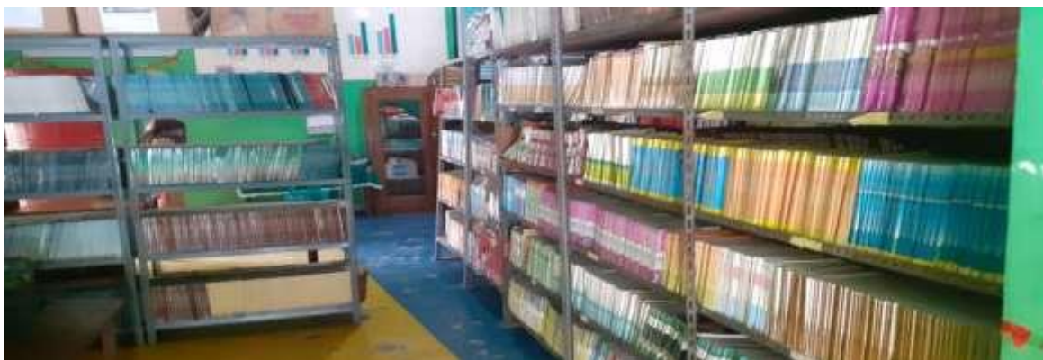
Gambar 1.1. Rak Buku – buku Perpustakaan Sekolah Budaya