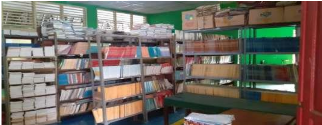
(a) Penataan Buku – buku Perpustakaan Sekolah Budaya

Hasil observasi dilapangan menunjukkan bahwa belum berfungsinya Perpustakaan sebagaimana mestinya karena faktor prasarana yang tidak mendukung serta pengelola yang kurang kompeten. Berikut gambaran kondisi Perpustakaan di mitra :