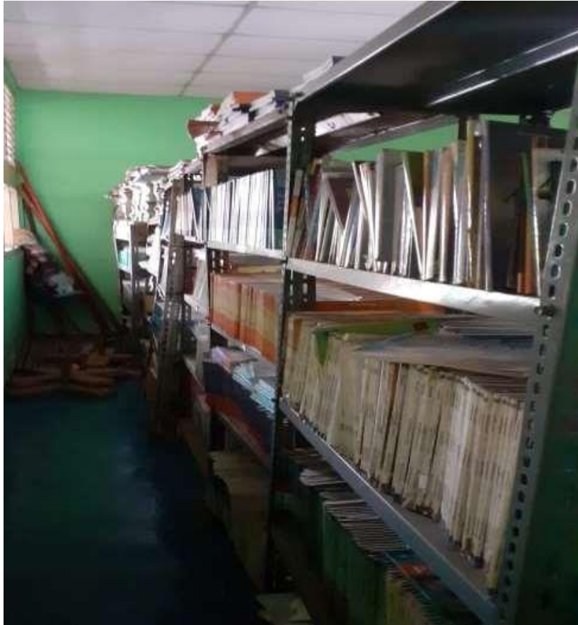
Gambar 1.2. Ruang Baca Perpustakaan dan Ruang Kepala Perpustakaan Sekolah Budaya

(b) Ruang baca Perpustakaan dan ruang kepala perpustakaan