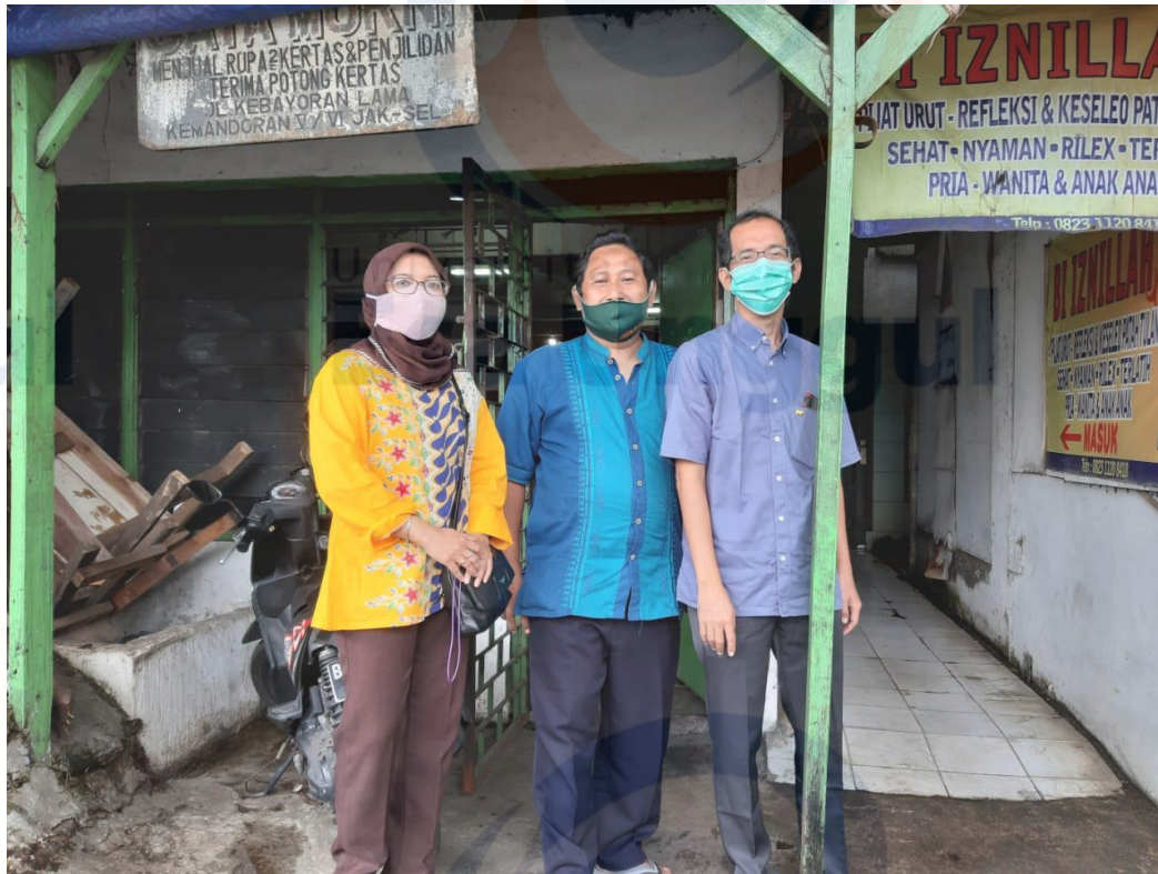
Gambar 1.2 Lokasi Mitra