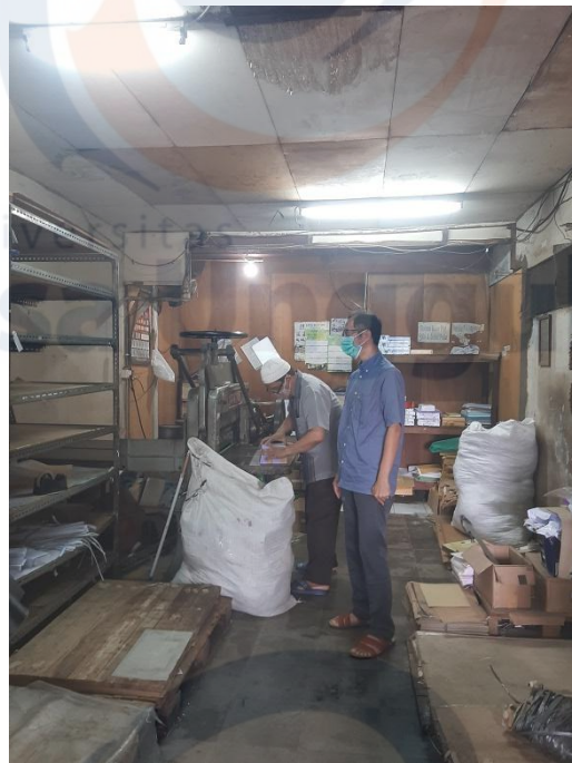
Gambar 1.3 Kondisi usaha mitra