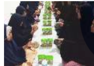
Ket: kegiatan audiensi dengan mitra terkait pembahasan masalah kebutuhan abdimas mitra