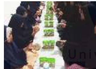
Ket: kegiatan audiensi dengan mitra terkait pembahasan masalah kebutuhan abdimas mitra

Pancasila sebagai dasar negara merupakan kesepakatan politik ketika negara Indonesia didirikan melalui sidang BPUPKI yang dihadiri dari berbagai utusan, baik dari utusan Islam maupun non-Islam. Pancasila merupakan pandangan hidup bangsa Indonesia. Pancasila artinya lima dasar atau lima asas yaitu nama dari dasar negara kita, Negara Republik Indonesia.