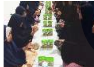
Ket: kegiatan audiensi dengan mitra terkait pembahasan masalah kebutuhan abdimas mitra

Pesantren adalah institusi pendidikan yang berada di bawah pimpinan seorang atau beberapa kiai/ulama dan dibantu oleh seorang santri senior serta beberapa anggota keluarganya. Pesantren menjadi bagian penting bagi kiai sebab pesantren dapat difungsikan sebagai tempat untuk berdakwah, mengembangkan, dan melestarikan ajaran Islam.