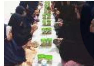
Ket: kegiatan audiensi dengan mitra terkait pembahasan masalah kebutuhan abdimas mitra