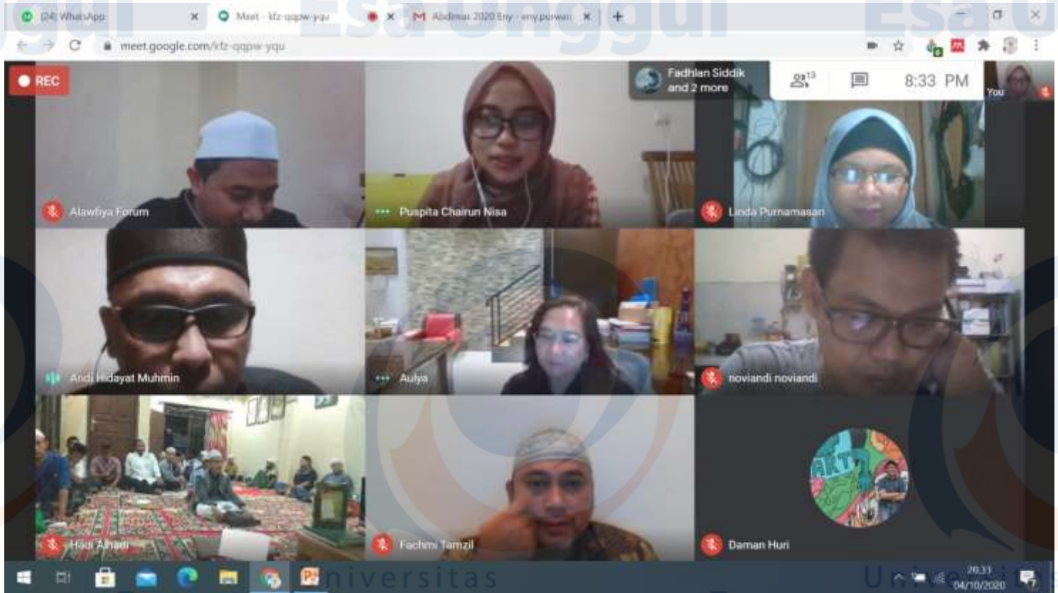
Situasi Webinar Pengabdian Masyarakat dengan Zoom Meeting