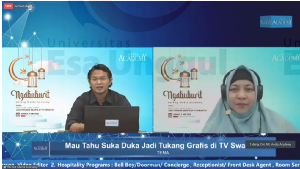
Foto: Acara Ngabuburit bareng Media Academy, Topik: Mau Tahu Suka Duka Jadi Tukang Grafis di TV Swasta?