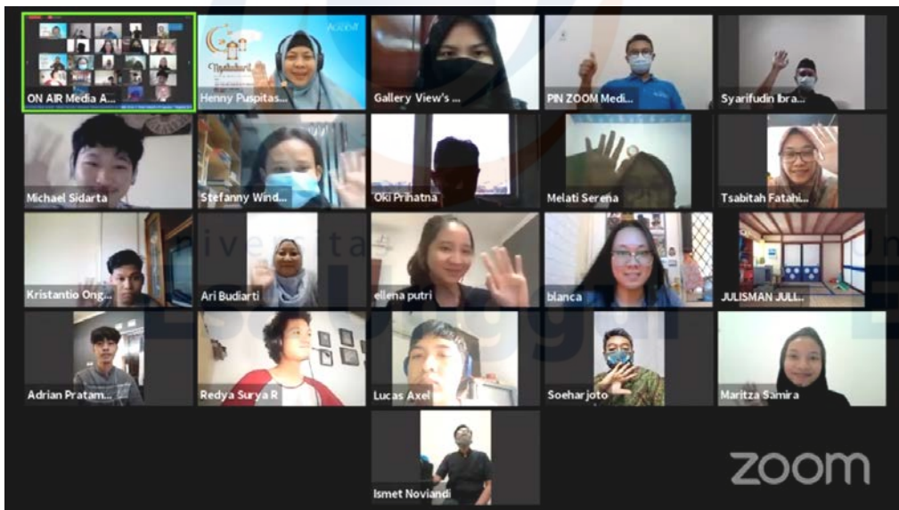
Foto bersama dengan peserta acara Ngabuburit bareng Media Academy, Topik: Mau Tahu Suka Duka Jadi Tukang Grafis di TV Swasta?