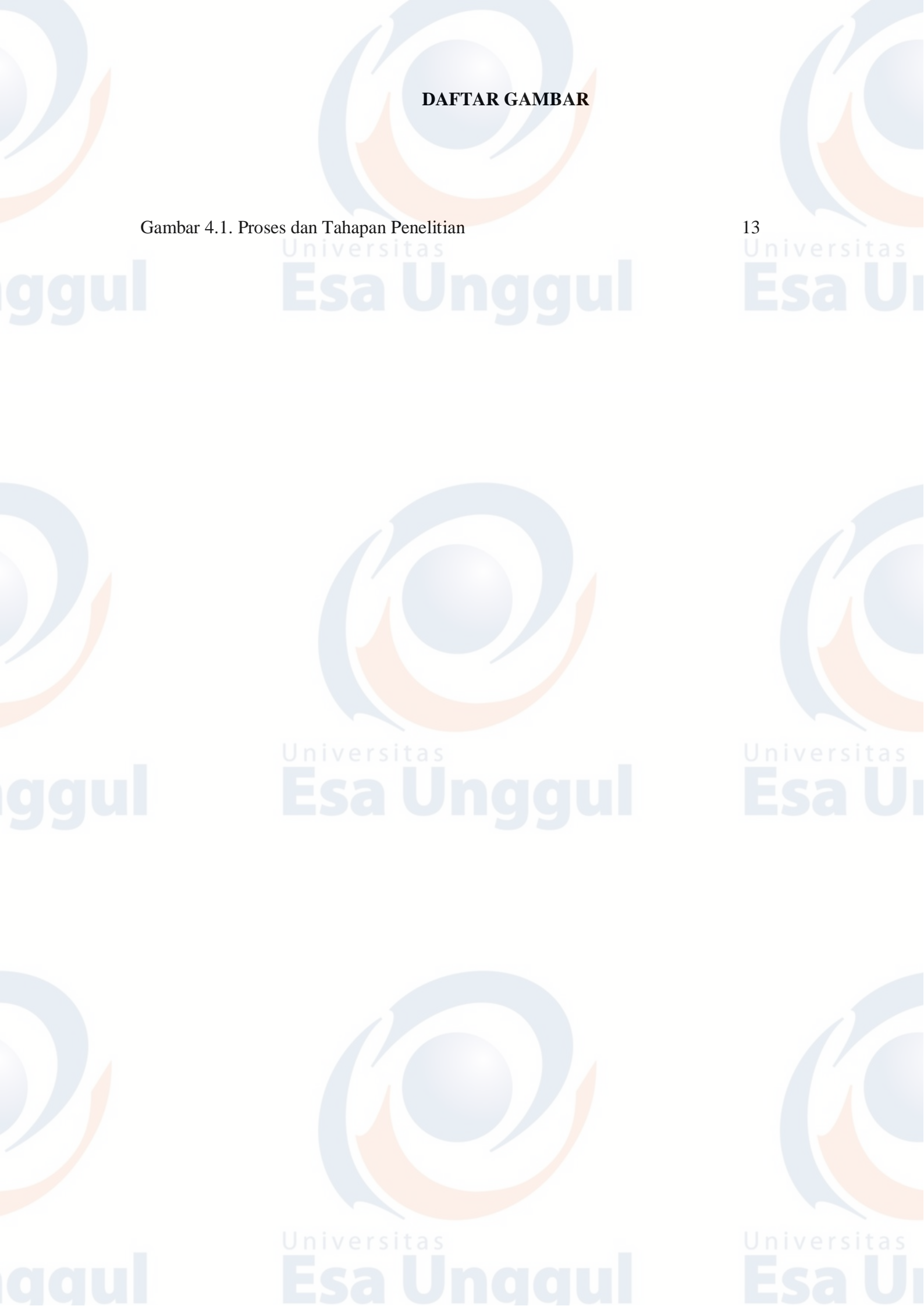
Gambar 4.1. Proses dan Tahapan Penelitian