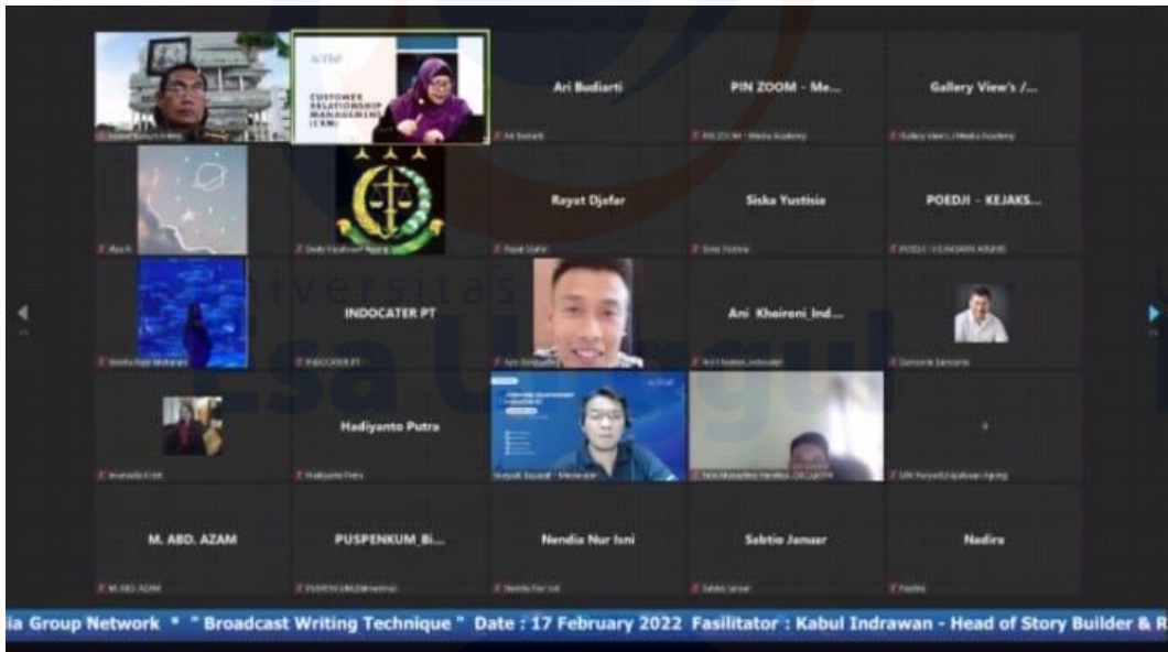
Foto bersama Public Training Media Academy, Topik: Customer Relationship Management