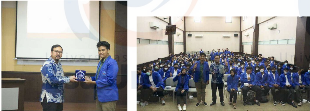
Gambar 4. Pemberian Plakat Kegiatan Abdimas