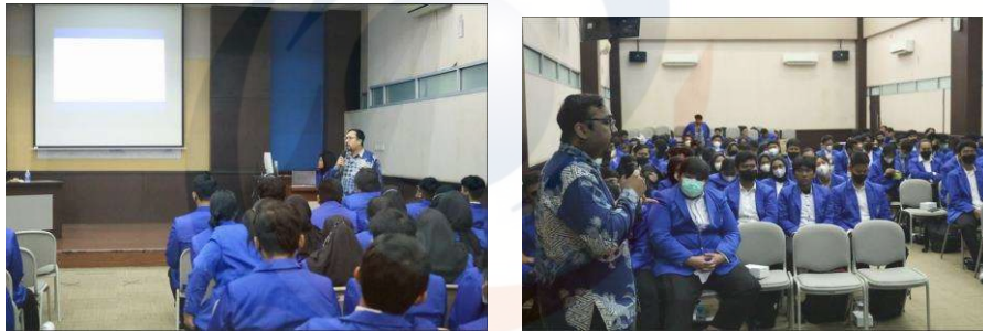
Gambar 2. Pemberian Materi Oleh Narasumber