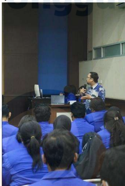
Gambar 3. Diskusi dan Tanya Jawab Materi Oleh Narasumber