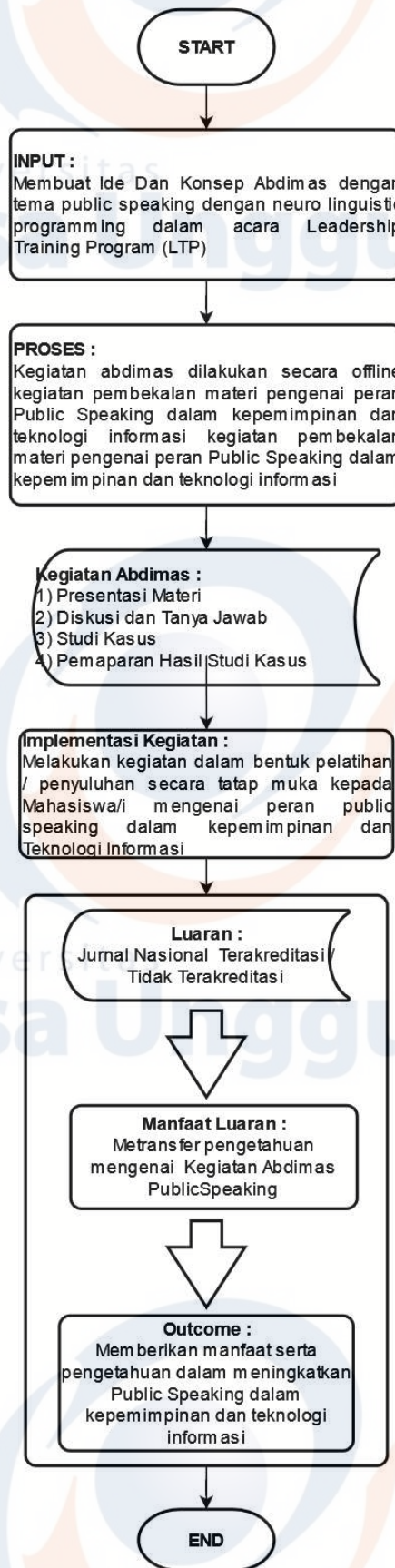
Gambar 1. IPTEKS yang ditransfer