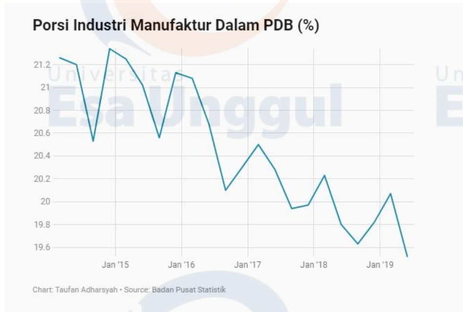
Gambar 1.1 Porsi Industri Manufaktur Dalam PDB ( % ).

Dalam Penelitian ini peneliti meneliti di perusahaan-perusahaan yang berada kawasan industri MM 2100 yang terletak di Cibitung. Didirikan pada tahun 1990 kawasan industri MM2100 merupakan pusat dari berdirinya perusahaan manufaktur raksasa asal Jepang, sebut saja seperti Honda, Toyota, Mitshubishi, Kawasaki, Hyundai dan lainnya membuka pabriknya disini.