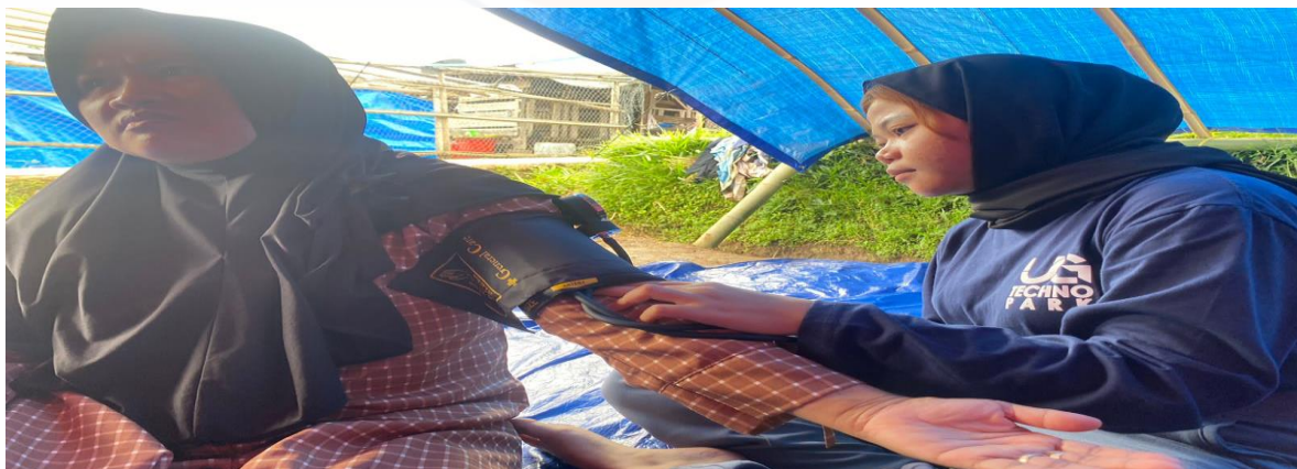
PEMERIKSAN KESEHATAN DAN PEMBERIAN ASUHAN PADA PASIEN DI POSKO KESEHATAN WILAYAH TENDA PENGUNGSIAN