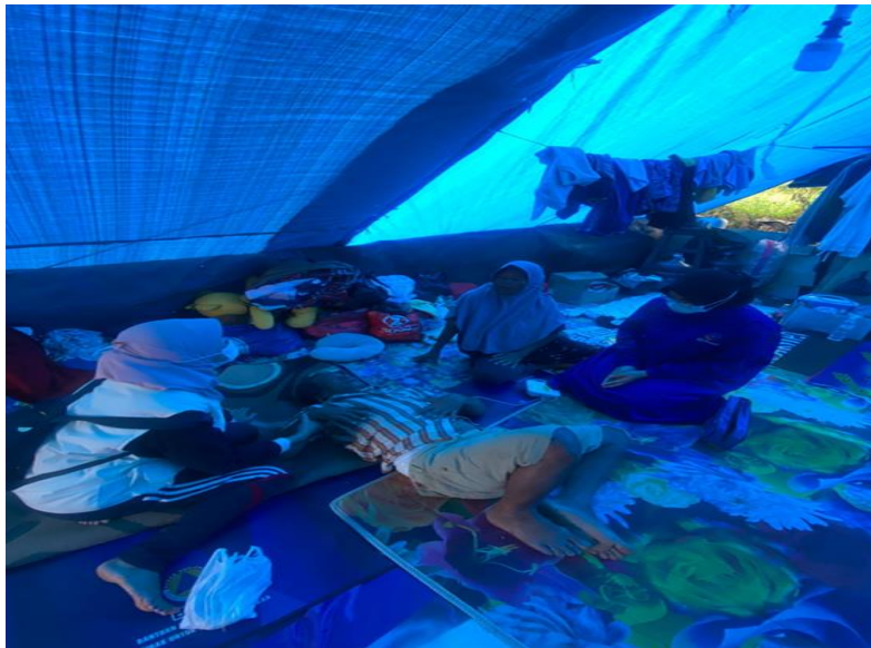
Gambar 2. Melakukan Pemberian Asuhan Keperawatan Pada Warga Lansia (Gangguan aktifitas Gerak dan Penyakit Kulit)