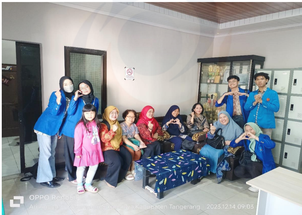
Gambar 2. Kunjungan ke Aula Kepala Desa Merak, Kecamatan Sukamulya Tangerang