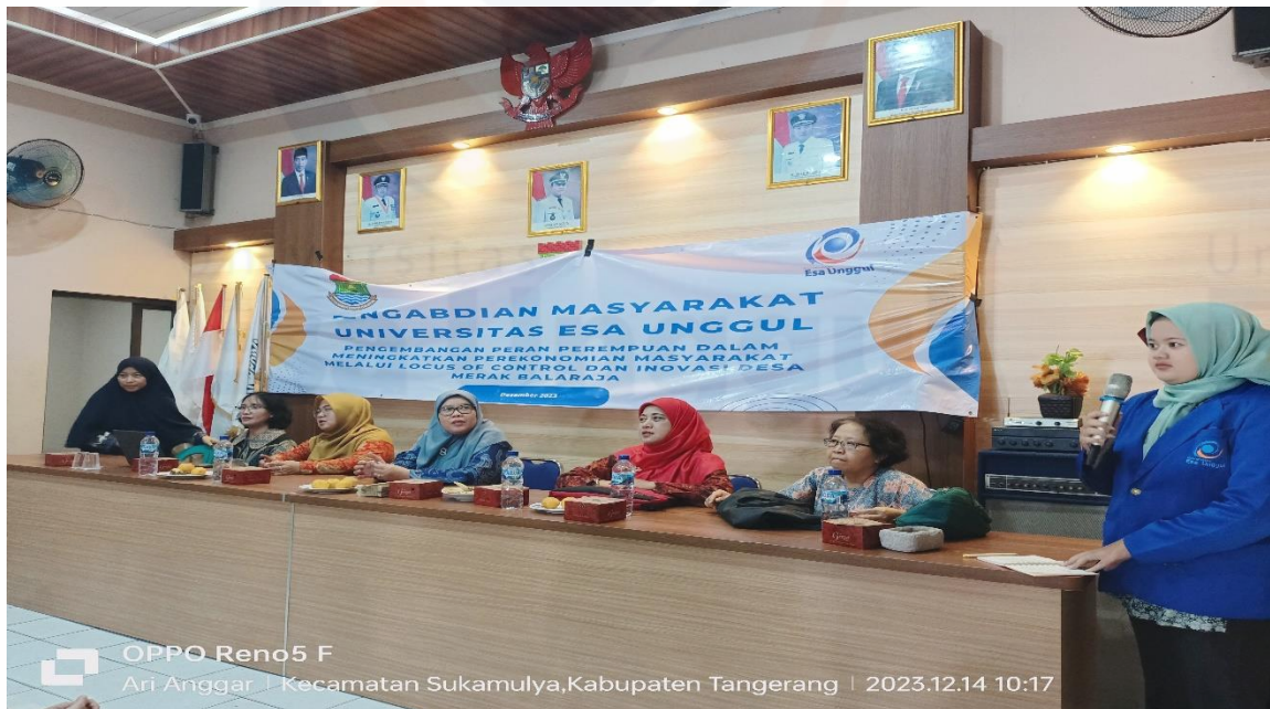
Gambar 3. Sesi Pembukaan pelatihan di Aula Desa Merak

Kegiatan pembukaan pendampingan dilakukan oleh Kepala Desa Merak beserta jajarannya dan Pejabat LPPM Universitas Esa Unggul yang diwakili oleh Kepala Bagian Pengabdian Kepada Masyarakat yang menjelaskan maksud dan tujuan pendampingan dan memperkenalkan tim yang hadir kepada peserta kegiatan pelatihan ini.