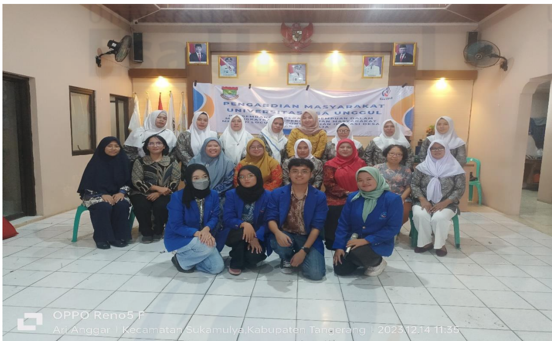
Gambar 4. Sesi foto bareng bersama team pengabdian masyarakat, ibu – ibu PKK dan Mahasiswa UEU

Kegiatan pembukaan ini juga dihadiri oleh beberapa Dosen Universitas Esa Unggul yaitu dosen Fakultas Ilmu Komunikasi dan Fakultas Ekonomi dan Bisnis, serta beberapa mahasiswa/i Universitas Esa Unggul yang terlibat dalam kegiatan pengabdian masyarakat dan peserta kegiatan pendampingan yang merupakan Ibu – Ibu PKK Desa Merak Kecamatan Sukamulya Tangerang.