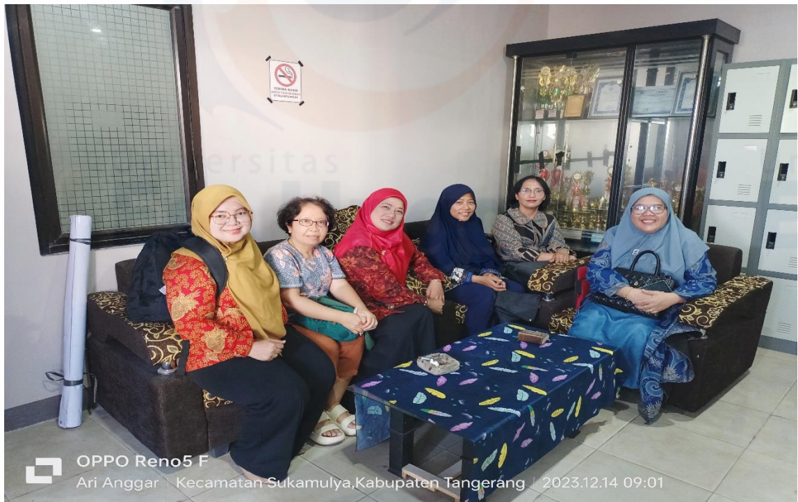
Gambar 1. Kunjungan ke Aula Kepala Desa Merak, Kecamatan Sukamulya Tangerang