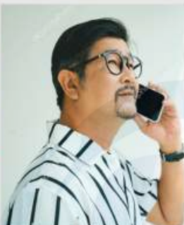
(Generasi X) Menelepon Langsung