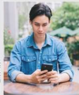
(Generasi Z - Alpha) WA saja.