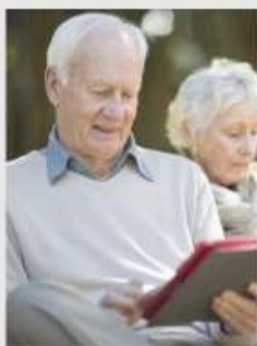
(Generasi Baby Boomer) Mencatat / Ditulis