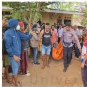
Seorang WJ di salah satu DK mahasiswa Unesa Semarang, diduga bunuh diri di salah satu lokasi