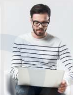
(Generasi Millennial) Saling Email