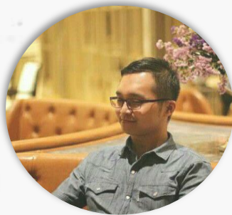
PAOLI FOUNDER | CEO CIK LAMPUNG