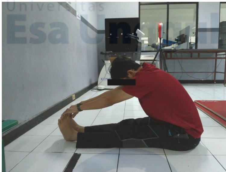
Perlakuan I long sitting exercise