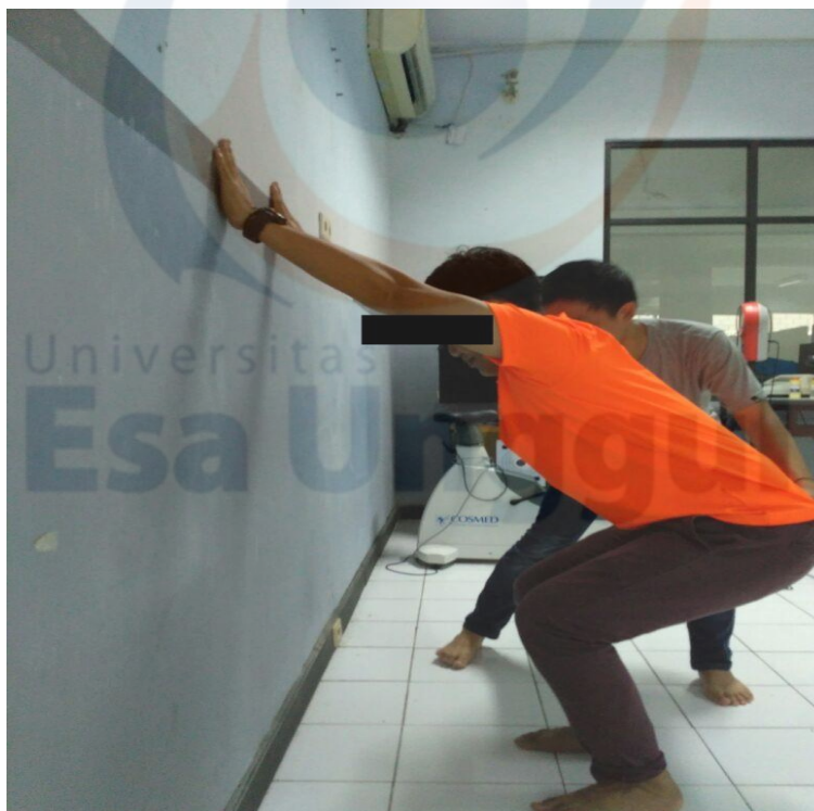
Perlakuan II push wall squat exercise