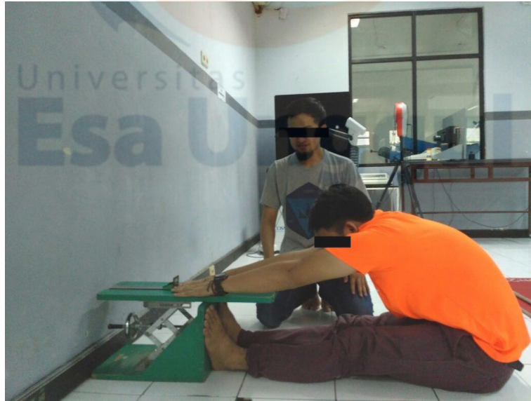
Pengukuran dengan sit and reach test