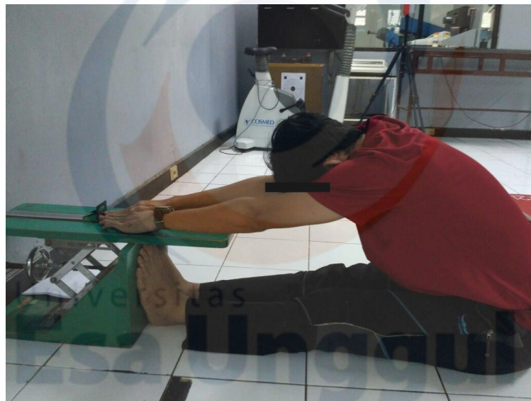
Pengukuran dengan sit and reach test