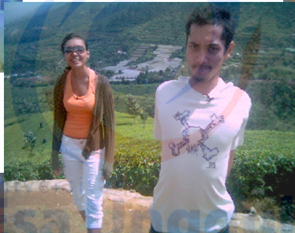
PRESENTER BOYS' TOYS