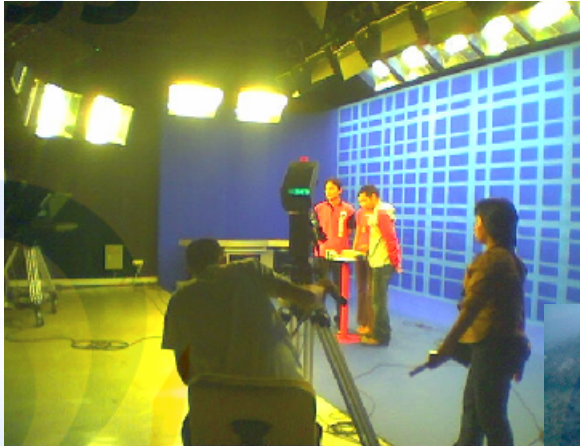
SHOOTING STUDIO PRESENTER