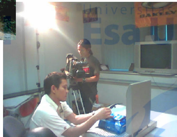
SHOOTING LIPUTAN "OAKLEY"