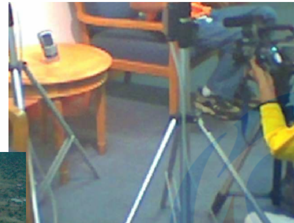
SHOOTING LIPUTAN "BLACKBERRY"