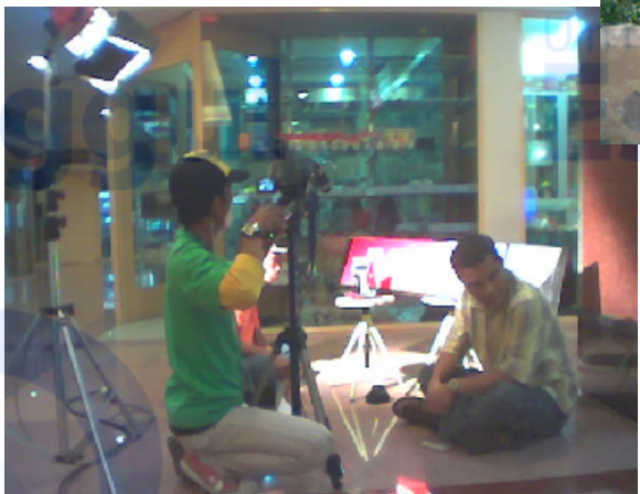
SHOOTING LIPUTAN "JVC"