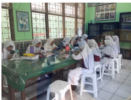
Gambar 3 Intervensi menggunakan media tumbler double wall terkait makanan Jajanan 29/01/2019