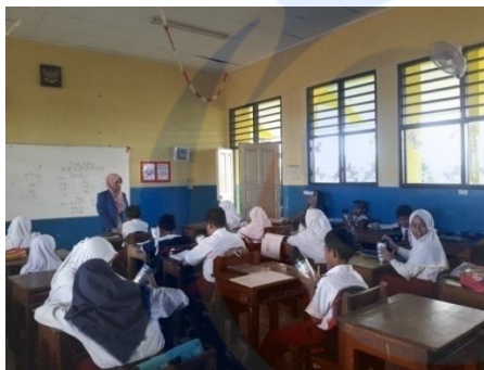
Gambar 3 Intervensi menggunakan media tumbler double wall terkait makanan Jajanan 29/01/2019