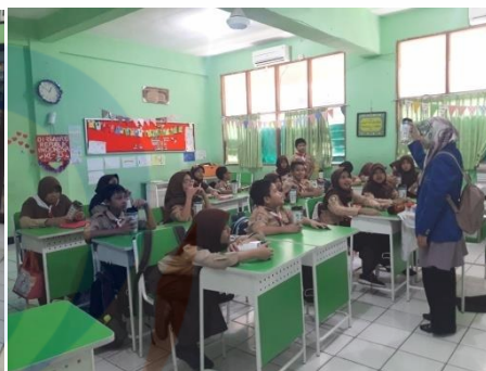
Gambar 4 Intervensi menggunakan media tumbler double wall terkait makanan Jajanan 30/01/2019