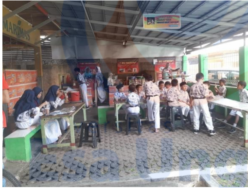
Gambar 1 Kantin di SDN Duri Kepa 03 Pagi