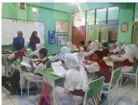
Gambar 1 Pre-test pengetahuan, sikap dan tindakan memilih makanan Jajanan 28/01/2019