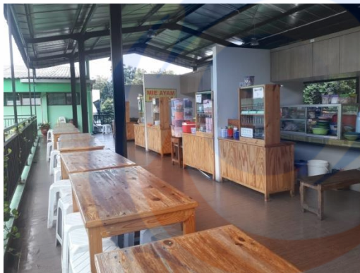
Gambar 1 Kantin di SDIT Al-Chasanah