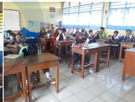
Gambar 4 Intervensi menggunakan media tumbler double wall terkait makanan Jajanan 30/01/2019