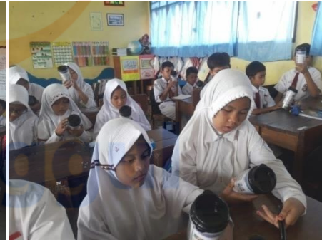
Gambar 2 Intervensi menggunakan media tumbler double wall terkait makanan Jajanan 28/01/2019