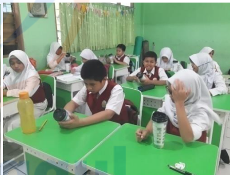
Gambar 2 Intervensi menggunakan media tumbler double wall terkait makanan Jajanan 28/01/2019