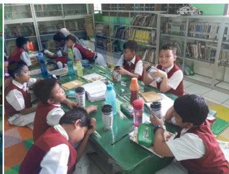
Gambar 6 Beberapa Siswa-siswi membawa bekal minum 29/01/2019