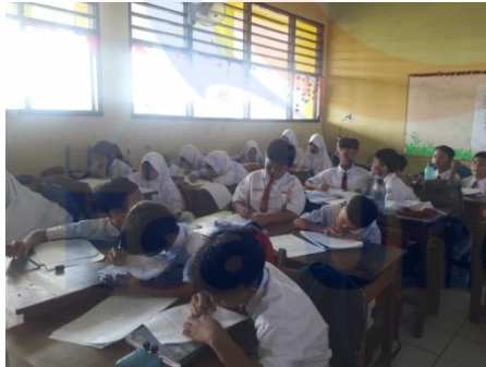
Gambar 1 Pre-test pengetahuan, sikap dan tindakan memilih makanan Jajanan 28/01/2019