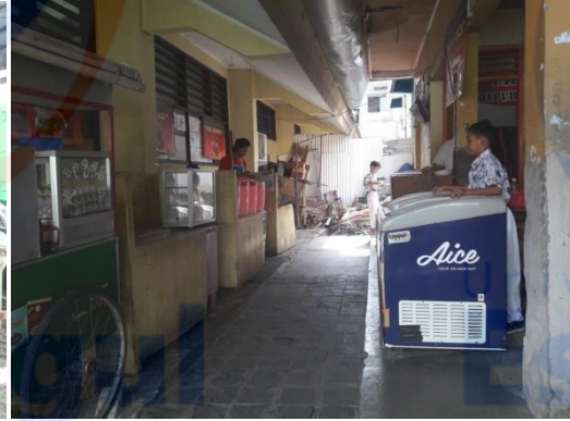
Gambar 2 Kantin di SDN Duri Kepa 03 Pagi