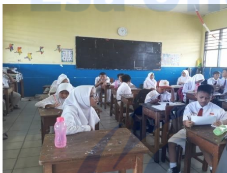
Gambar 5 Post-test pengetahuan, sikap dan tindakan memilih makanan Jajanan 04/02/2019