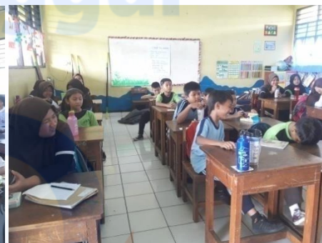
Gambar 6 Beberapa Siswa-siswi membawa bekal minum 30/01/2019