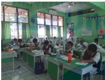
Gambar 5 Post-test pengetahuan, sikap dan tindakan memilih makanan Jajanan 04/02/2019