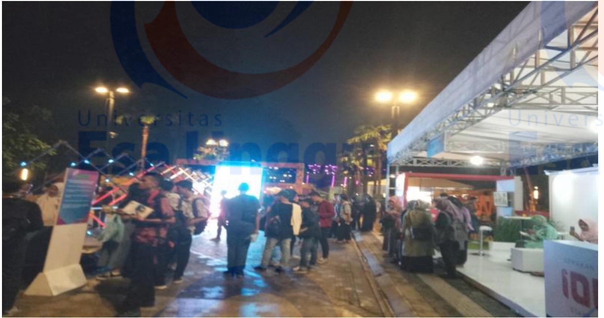
Suasana stand booth dan arena games SIBERKREASI NITIZEN FAIR 2018