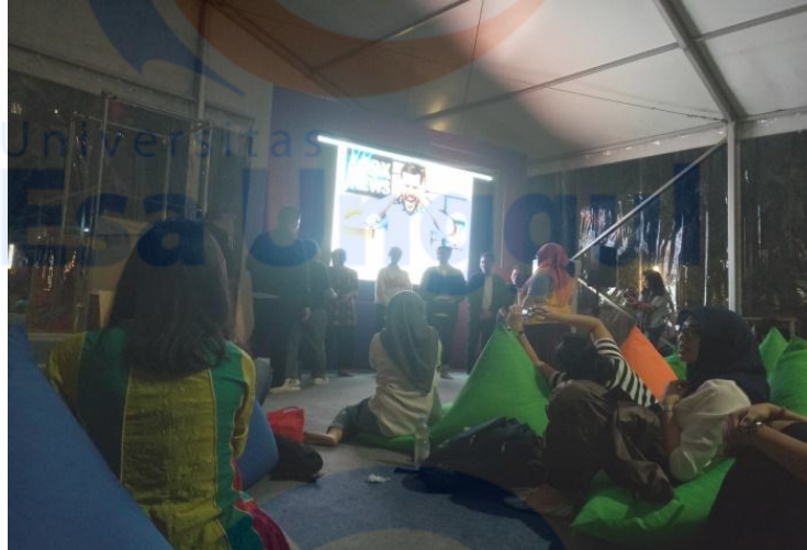
Foto suasana pada saat pengisian materi seminar “Generasi Anti Hoax #LawanKabarKibul”