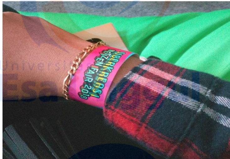
Tiket untuk memasuki arena SIBERKREASI NITIZEN FAIR 2018, Plaza Tenggara Gelora Bung Karno