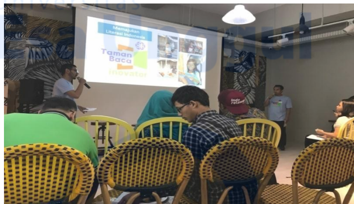
Suasana pada saat pengisian materi seminar “Digital Literacy Memberantas Hoax dengan Literasi”