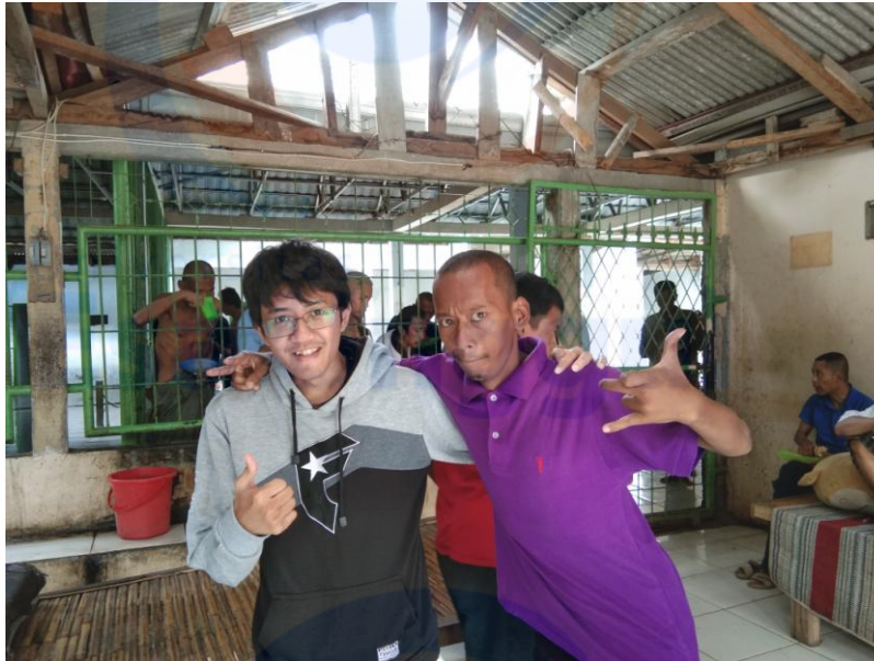
Foto Bersama dengan salah satu penghuni panti Yayasan Al-Fajar