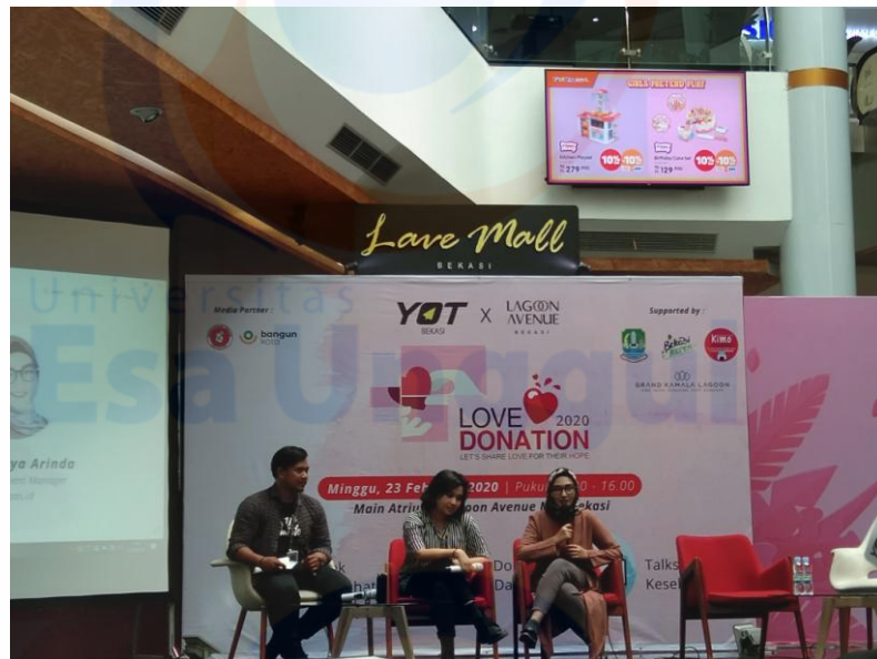
Observasi pada Talkshow membahas tentang Isu Kesehatan Mental yang di adakan oleh Young on Top pada Mall Lagoon Avenue Bekasi