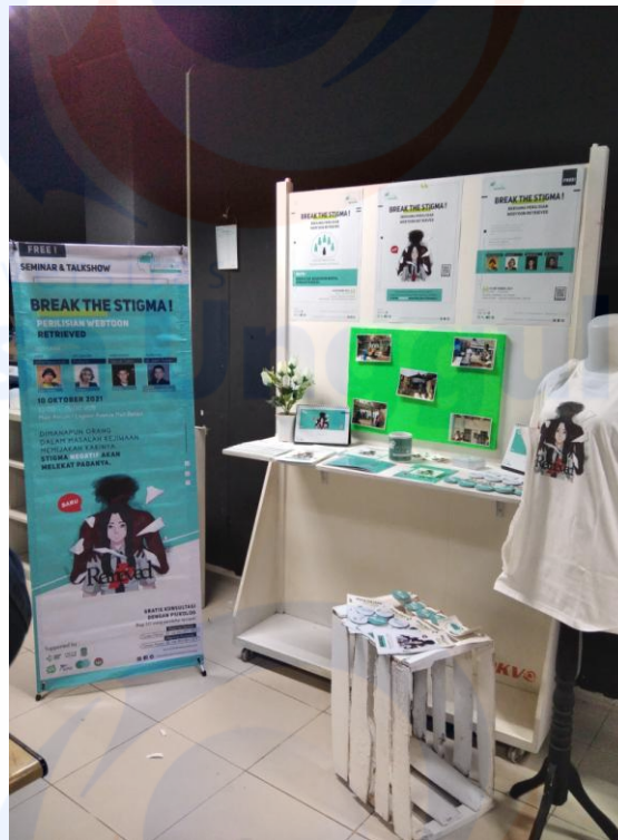
Hasil Display pameran Tugas Akhir