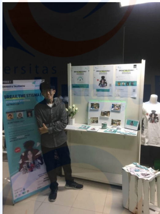
Hasil Display pameran Tugas Akhir