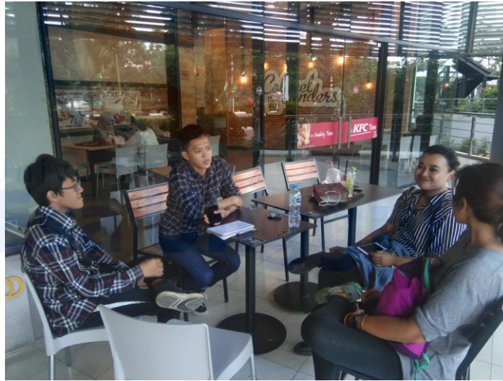
Mengikuti Sharing Session setelah acara Talkshow selesai