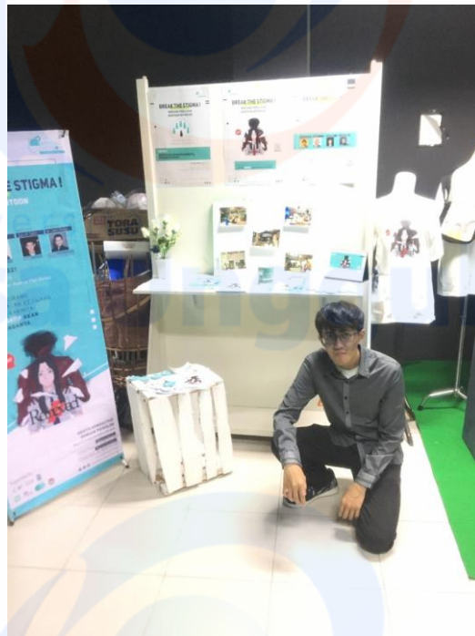
Hasil Display pameran Tugas Akhir