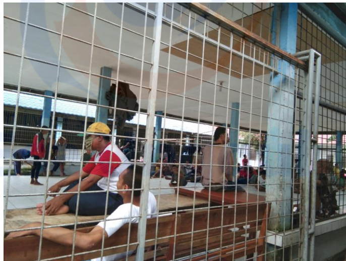
Dokumentasi kegiatan ODGJ pada Yayasan Al-Fajar Berseri