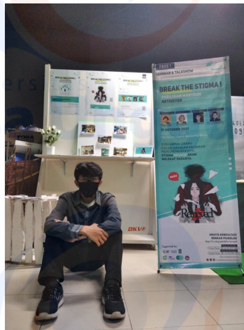
Hasil Display pameran Tugas Akhir