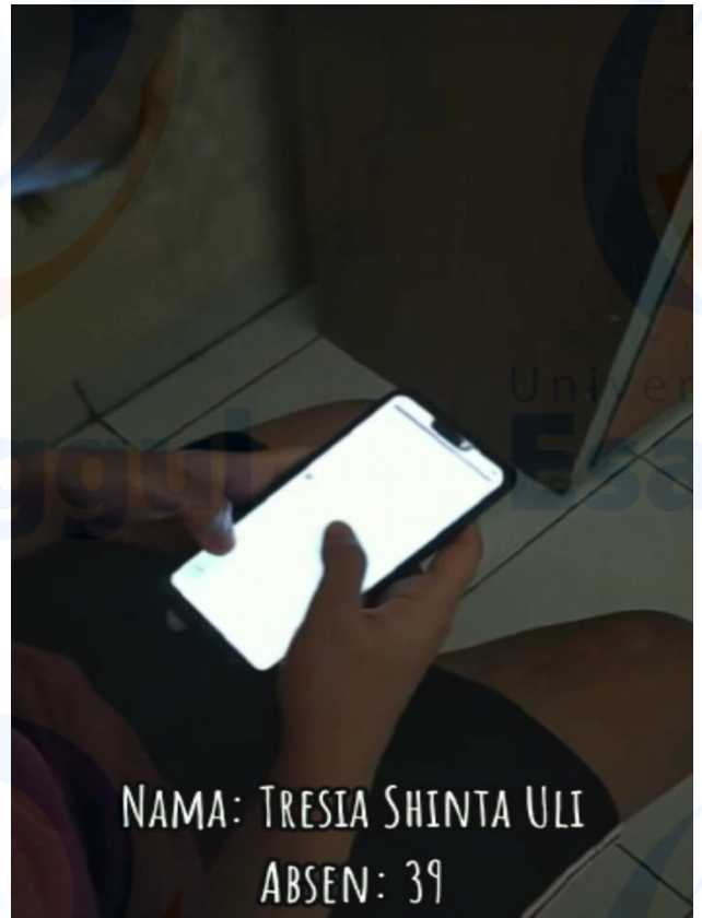
Foto Ijin Mengadakan Penelitian