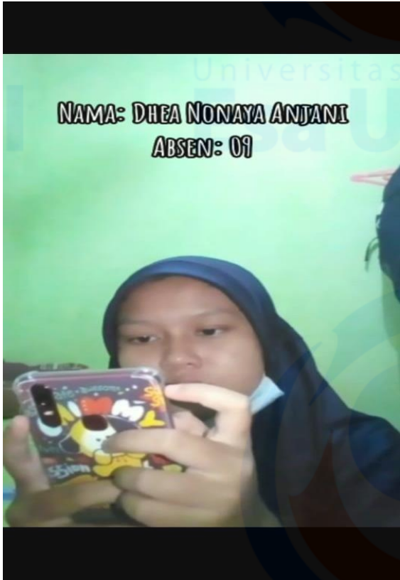
Foto responden mengisi Google Form