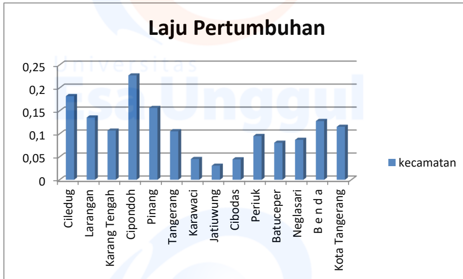
Tabel 1. 2 Laju Pertumbuhan

Berikut merupakan persentase laju pertumbuhan penduduk kota Tangerang dari tahun 2010-2019 :