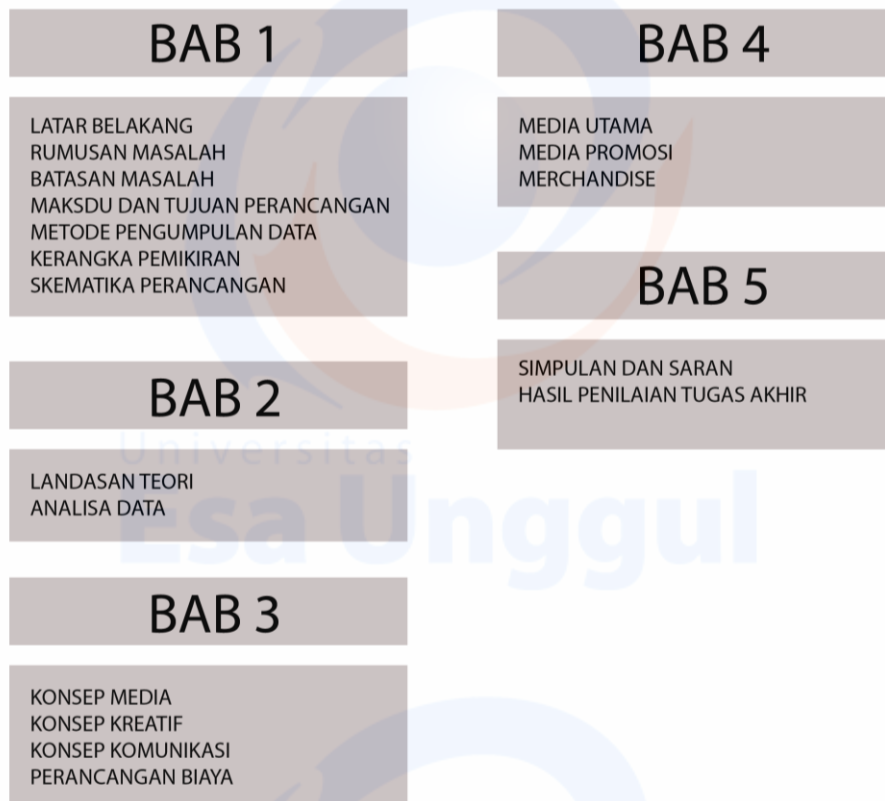
Gambar 1.4 Bagan Sistematika Pemikiran Gilang Chandra Saputra, 2020

Bab ini berisi tentang kesimpulan menyeluruh dan saran yang diperoleh penulis dari analisis dan pembahasan terhadap masalah yang sudah diamati.