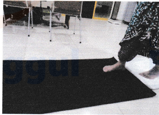
Tahap awal jalan