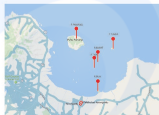
Peta Lokasi Penelitian