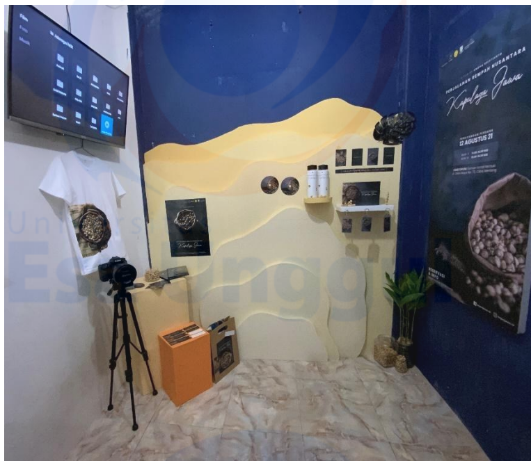
Dokumentasi Booth Tugas Akhir