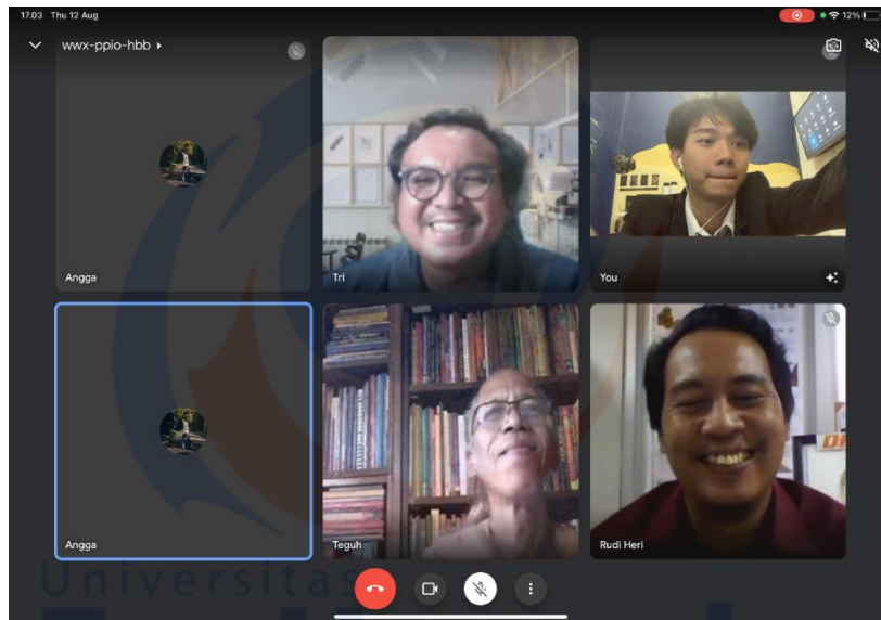
Dokumentasi Saat Sidang Tugas Akhir Berlangsung

Link : https://meet.google.com/wvx-ppio-hbb