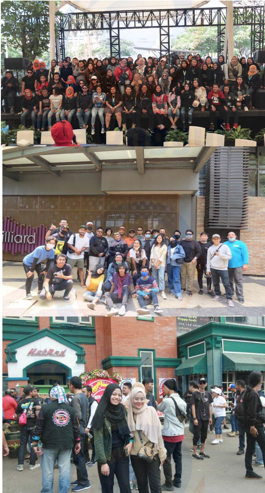
Gambar 4. Kegiatan Kunjungan Ke Komunitas Lain/Rolling