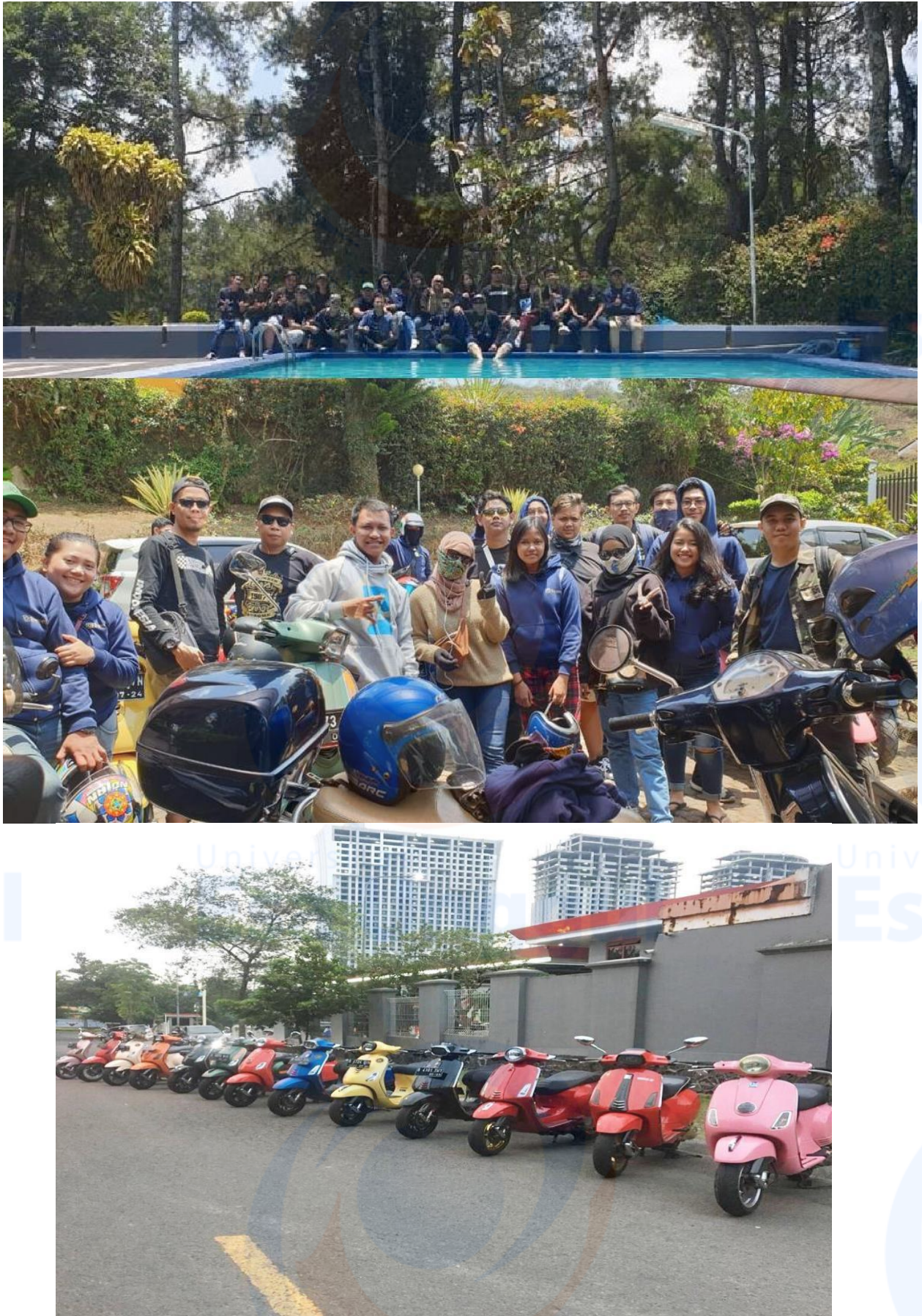
Gambar 5. Kegiatan Touring