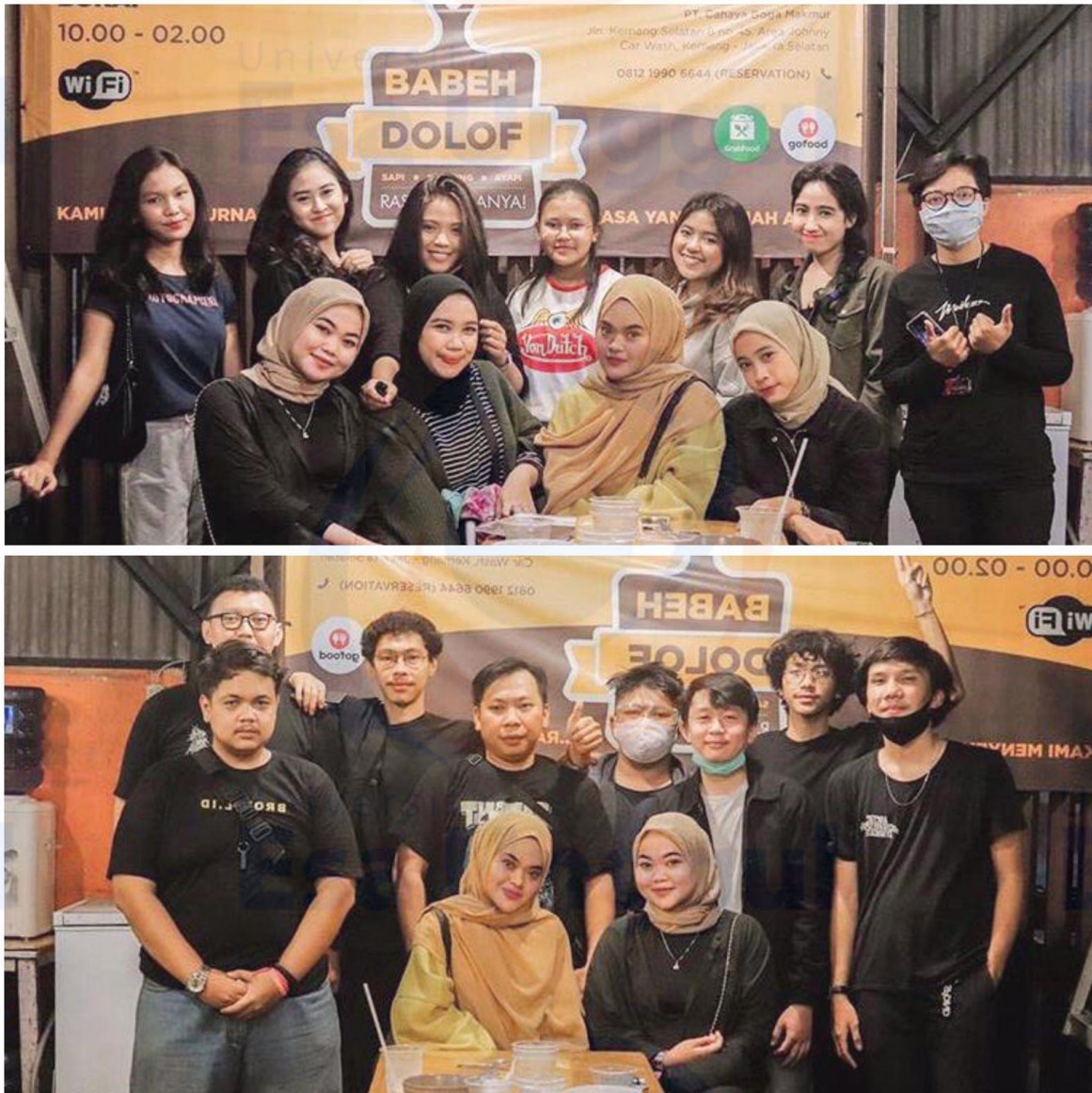
Gambar 8. Struktur keorganisasian komunitas vespa brovel