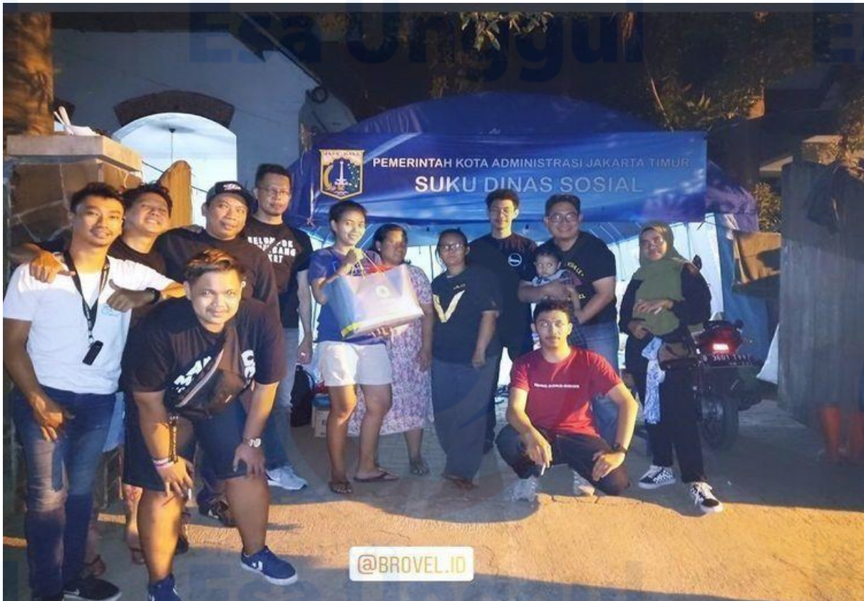
Gambar 6. Kegiatan Bakti Sosial