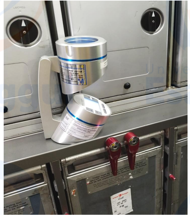
Pengukuran Angka Kuman Udara di dalam Pesawat