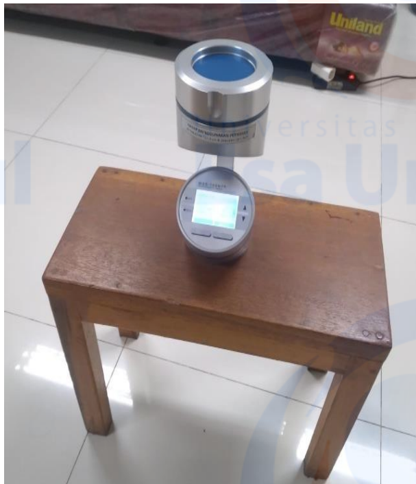
Pengukuran Angka Kuman Udara Ruang Petugas KKP Kelas I Soekarno Hatta di Terminal Bandar Udara Soekarno Hatta