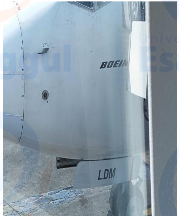
Kode Registrasi Bus dan Pesawat