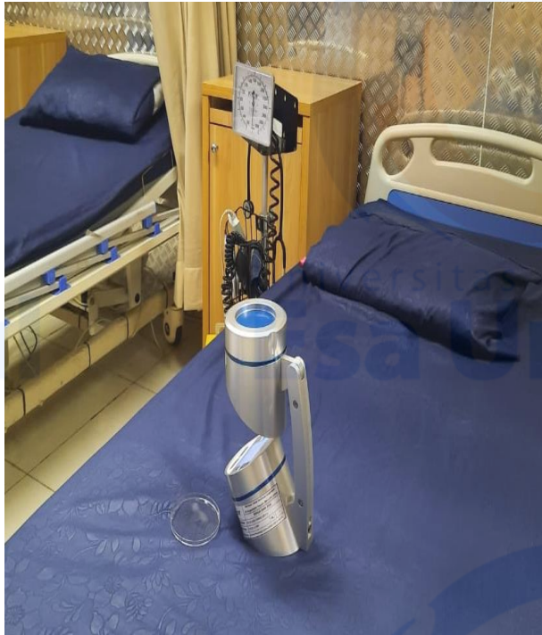
Pengukuran Angka Kuman Udara di Klinik KKP Kelas I Soekarno Hatta