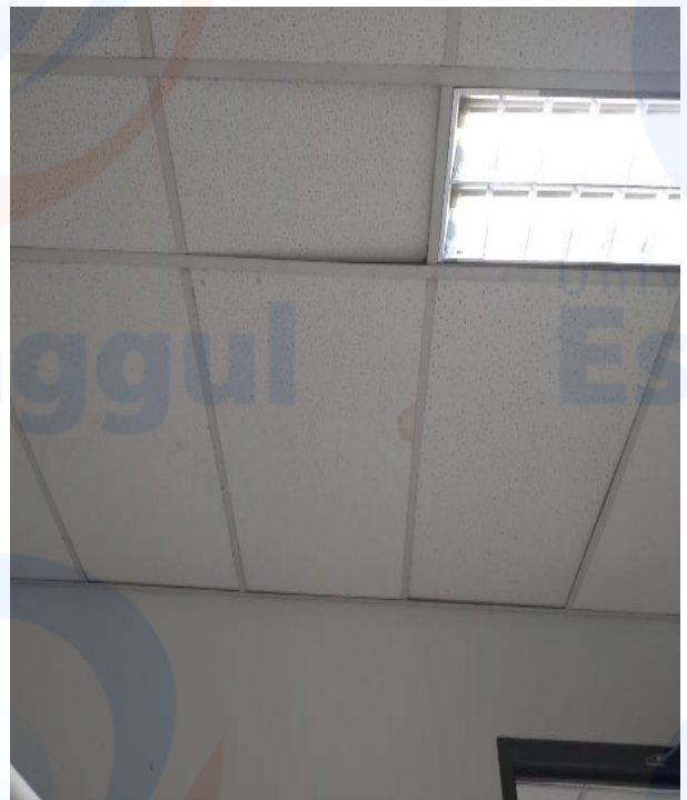
Kondisi Langit-langit dan AC di ketiga lokasi Terminal 3 Domestik