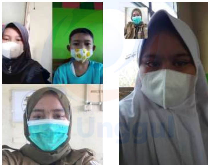
Gambar 5. Proses wawancara yang dilakukan peneliti oleh peserta didik kelas VA melalui video call