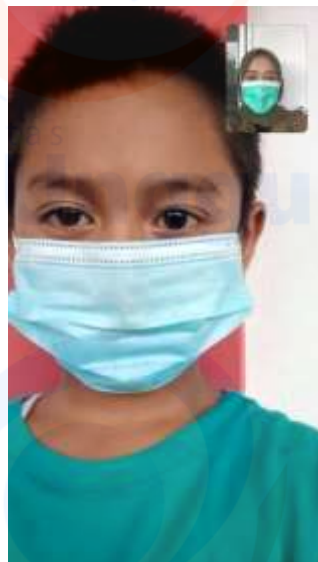
Gambar 4. Proses wawancara yang dilakukan peneliti oleh peserta didik kelas VA melalui video call