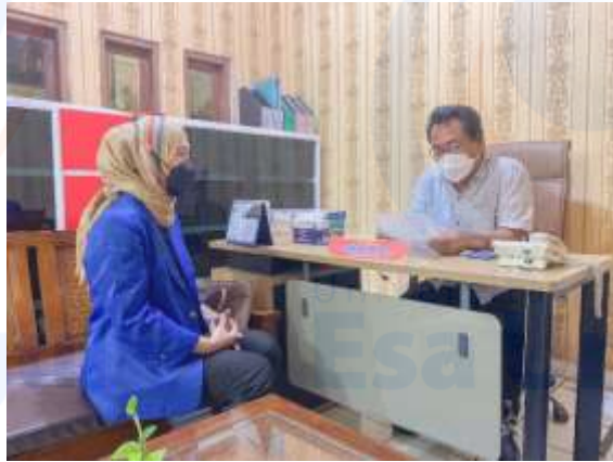
Gambar.1 Peneliti datang kesekolah dan meminta izin kepada kepala sekolah untuk melakukan penelitian di SDN Serdang Wetan Tangerang