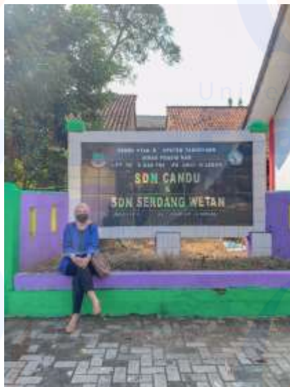
Gambar 3. Peneliti berfoto didepan lokasi sekolahan SDN Serdang Wetan Tangerang