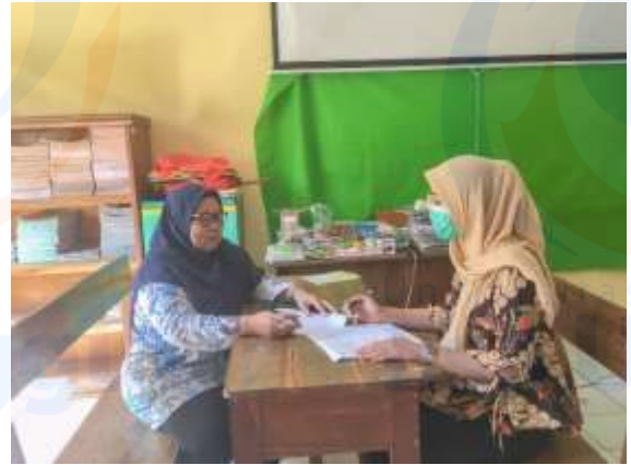
Gambar.2 Peneliti melakukan proses wawancara kepada guru kelas VA