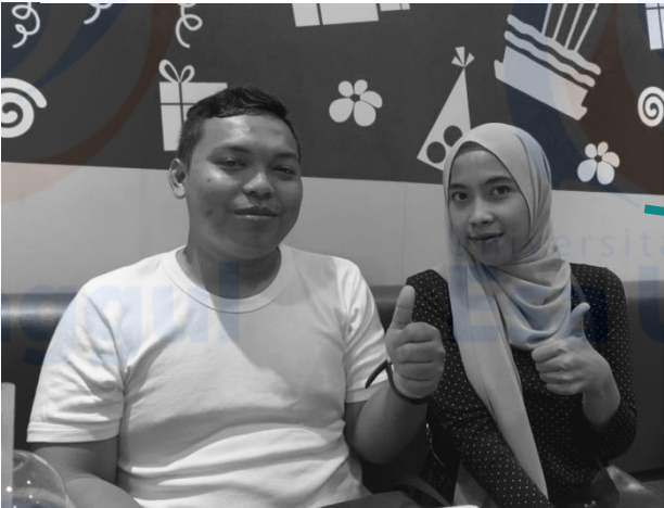
Gambar 13 Dokumentasi Wawancara Key Informan