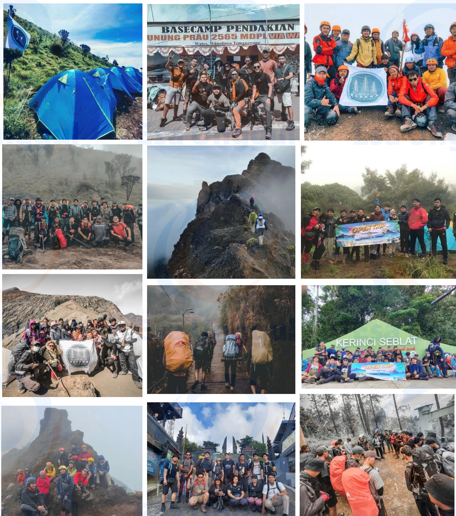
Gambar 12 Dokumentasi Peserta Trip Savana