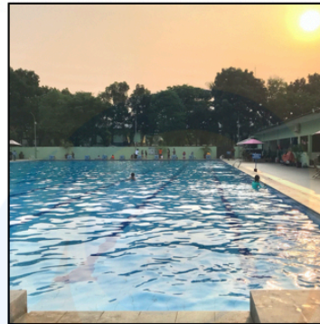
Kolam Renang 50m