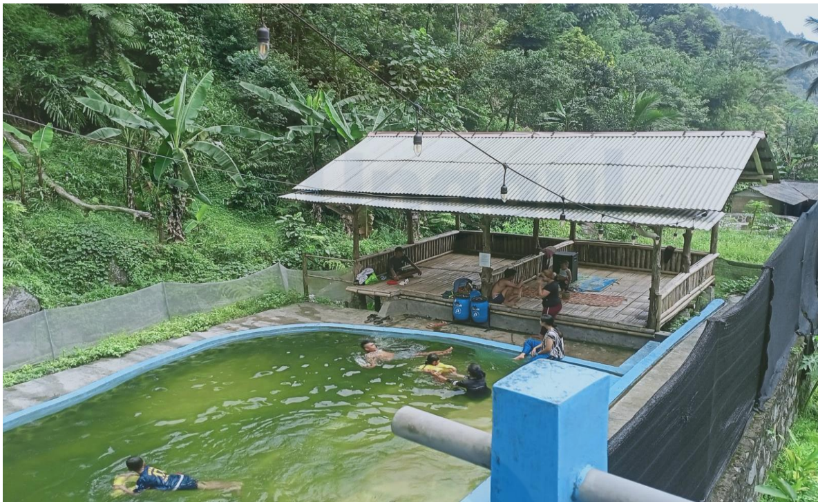
Wisata Alam Desa Ciasmara