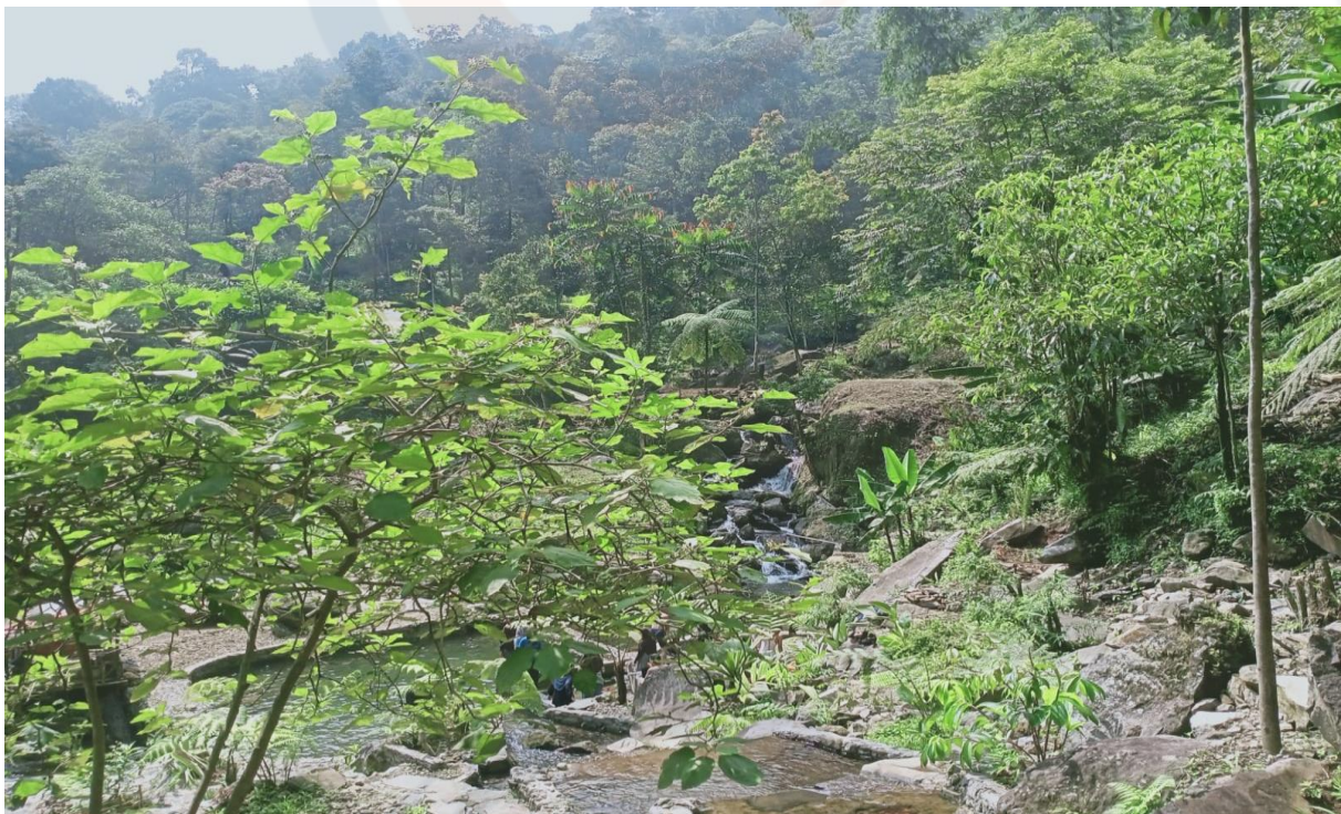
Wisata Alam Desa Ciasmara