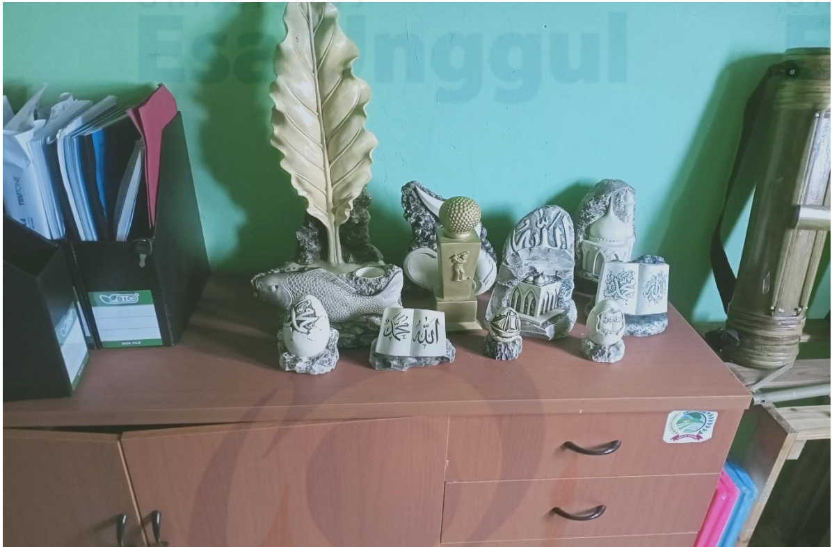
Kerajinan Tangan Bumdes