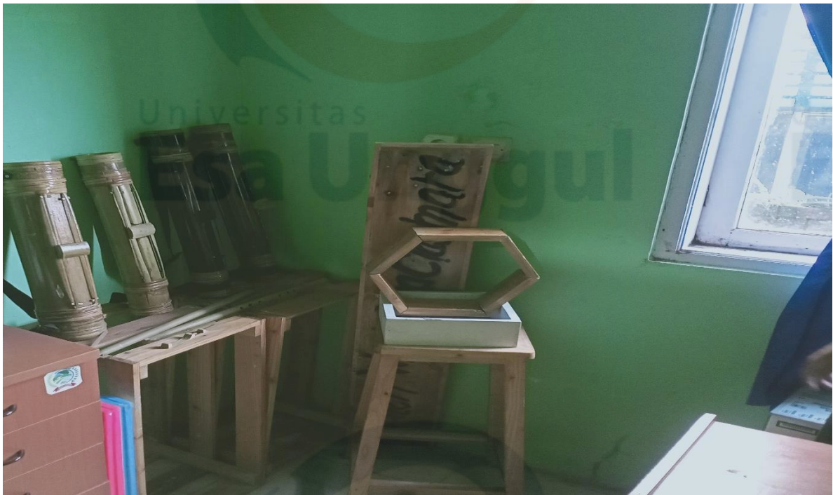
Alat Musik Tradisional