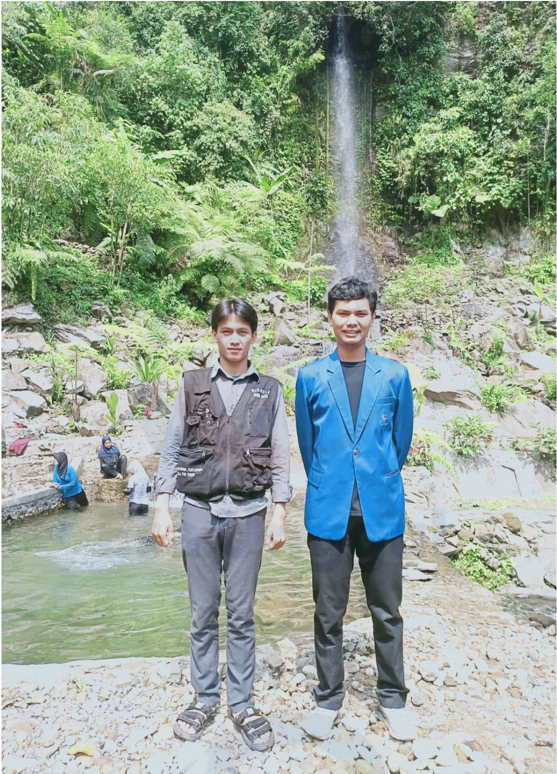
Foto Bersama Ketua Badan Usaha Milik Desa