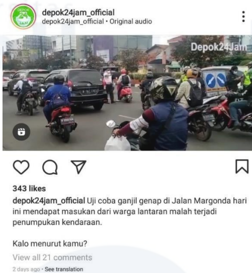
Gambar 1.3 Contoh postingan yang di unggah pada Akun @depok24jam_official, mengenai uji coba ganjil genap di Jalan Margonda 04/12/2021.

Melalui akun @depok24jam_official para followers dapat saling terhubung untuk saling bertukar informasi atau hanya untuk sekedar mencari informasi yang disajikan dalam akun @depok24jam_official. Followers dapat berpartisipasi aktif dan interaktif karena dalam instagram memungkinkan terjadinya komunikasi dua arah dalam kolom komentar. Interaksi dua arah terjadi pada saat akun @depok24jam_official mengunggah informasi, dan followers akun tersebut memberikan tanggapan dengan cara memberikan komentar. Komentar yang di berikan followers tersebut kemudian direspon oleh followers akun @depok24jam_official yang lain, serta tak jarang admin dari akun @depok24jam_official ikut memberikan respon atau tanggapan pada komentar yang diberikan. Sehingga terjadi komunikasi dua arah serta pertukaran informasi yang terjadi tidak hanya melalui ungguhannya saja tetapi dapat melalui kolom komentar. Interaktivitas dalam instagram didukung juga oleh fitur yang ada pada instagram yaitu fitur like , share , hashtag , repost , dan komentar. Dalam instagram @depok24jam_official informasi yang diberikan adalah seputar kejadian di kota Depok, dan informasi itu juga didapat dari para followers -nya yang men- tag akun @depok24jam_official dalam postingannya, lalu