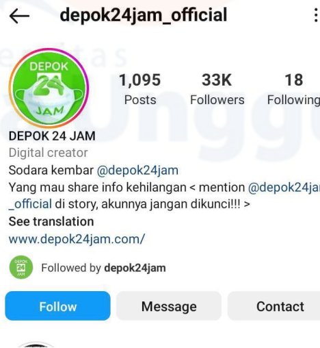
Gambar 1.2 Tampilan Profil Instagram @depok24jam_official