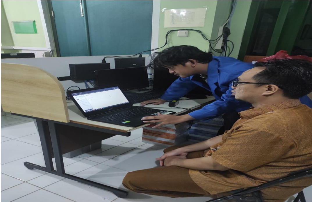
GAMBAR 1 MEMPRESENTASIKAN SISTEM KE STAFF TATA USAHA