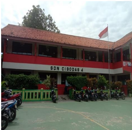
Gambar 1 Sekolah SDN Cibodas 4 Cibodas 4