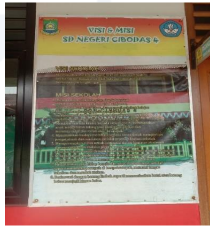
Gambar 2 Visi Misi SDN Cibodas 4