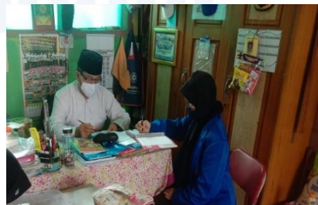
Gambar 2 Wawancara Dengan Guru VA