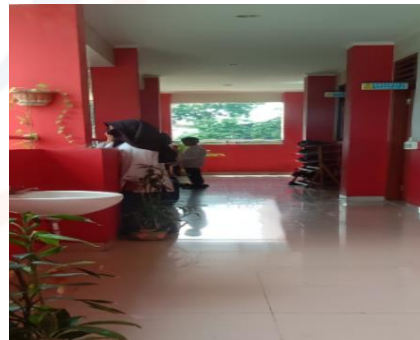
Gambar 4 Lorong Kelas VB