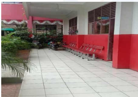
Gambar 3 Lorong Kelas VA