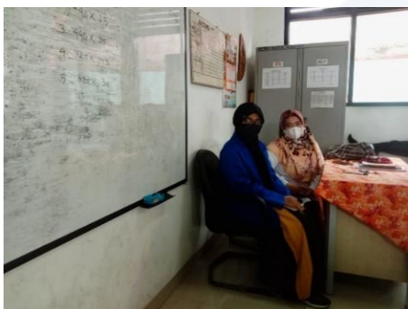
Gambar 3 Foto Bersama Guru VB