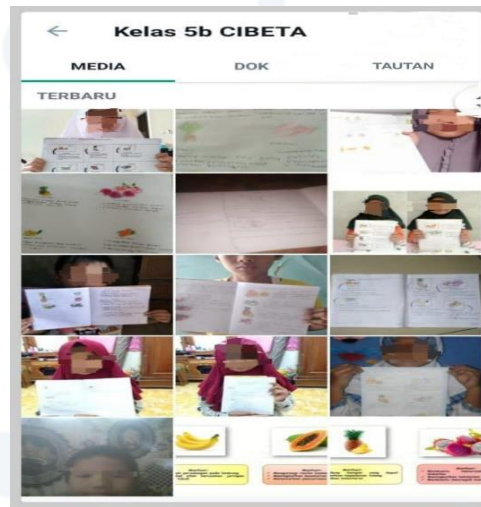
Gambar 2 Kelas VB Secara Daring