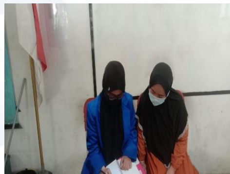
Gambar 4 Wawancara dengan Guru VB