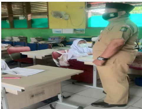
Gambar 3 Kelas VA Secara Luring