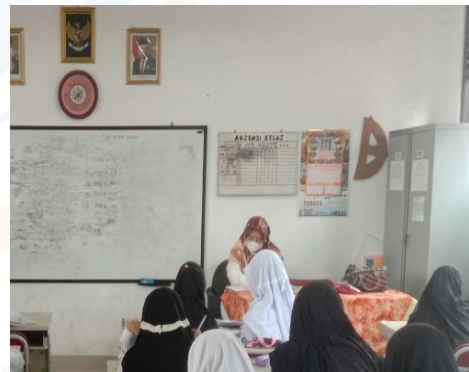
Gambar 4 Kelas VB Secara Luring