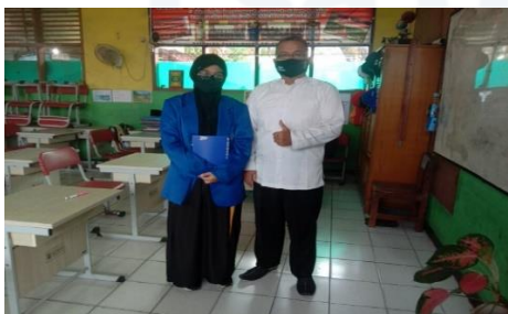
Gambar 1 Foto Bersama Guru VA