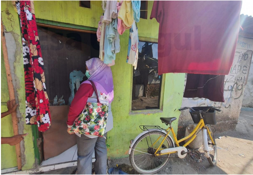
Kondisi Rumah Informan Utama 3