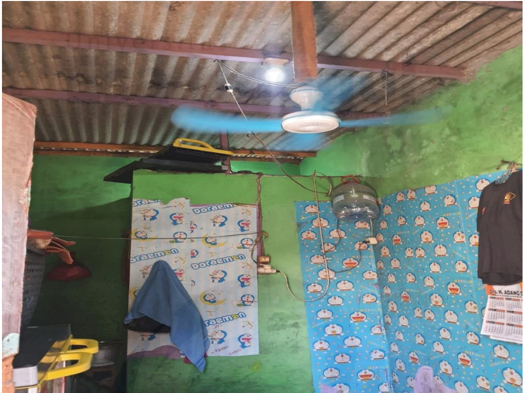
Ventilasi rumah Informan Utama 3