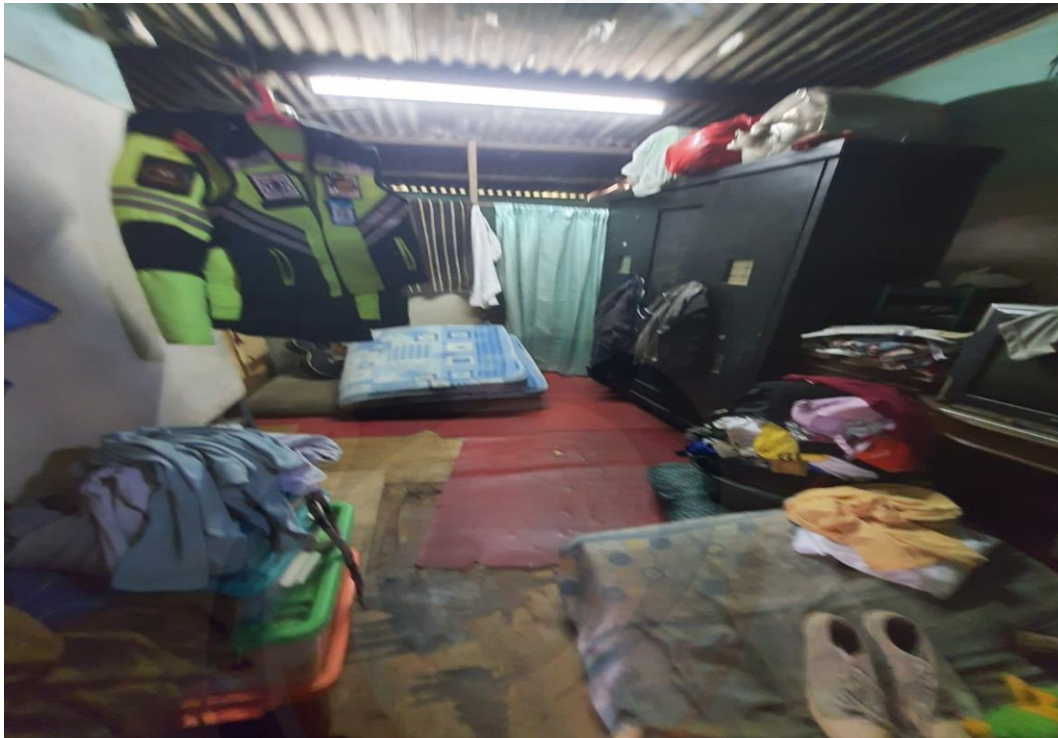
Rumah Informan Utama 1