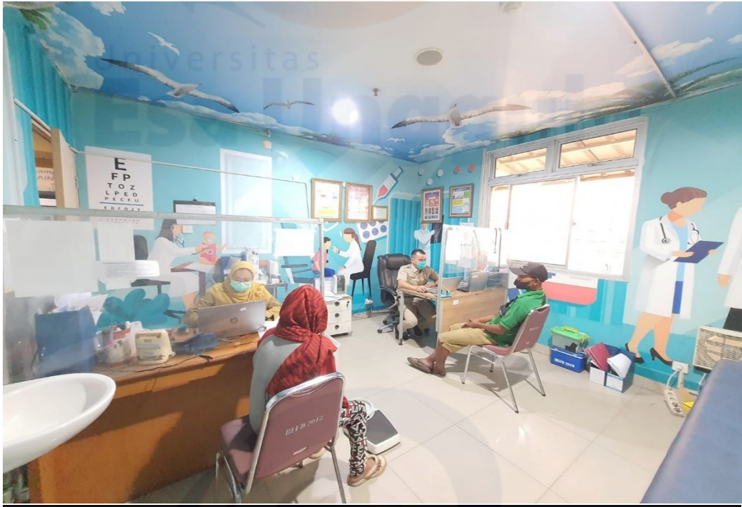
Ruang Poli TB paru