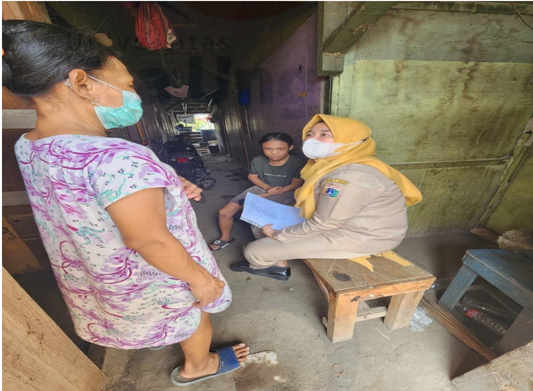
Wawancara dengan Informan utama