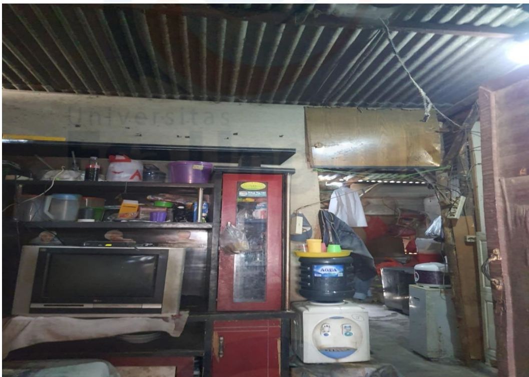
Kondisi atap rumah Informan Utama 2