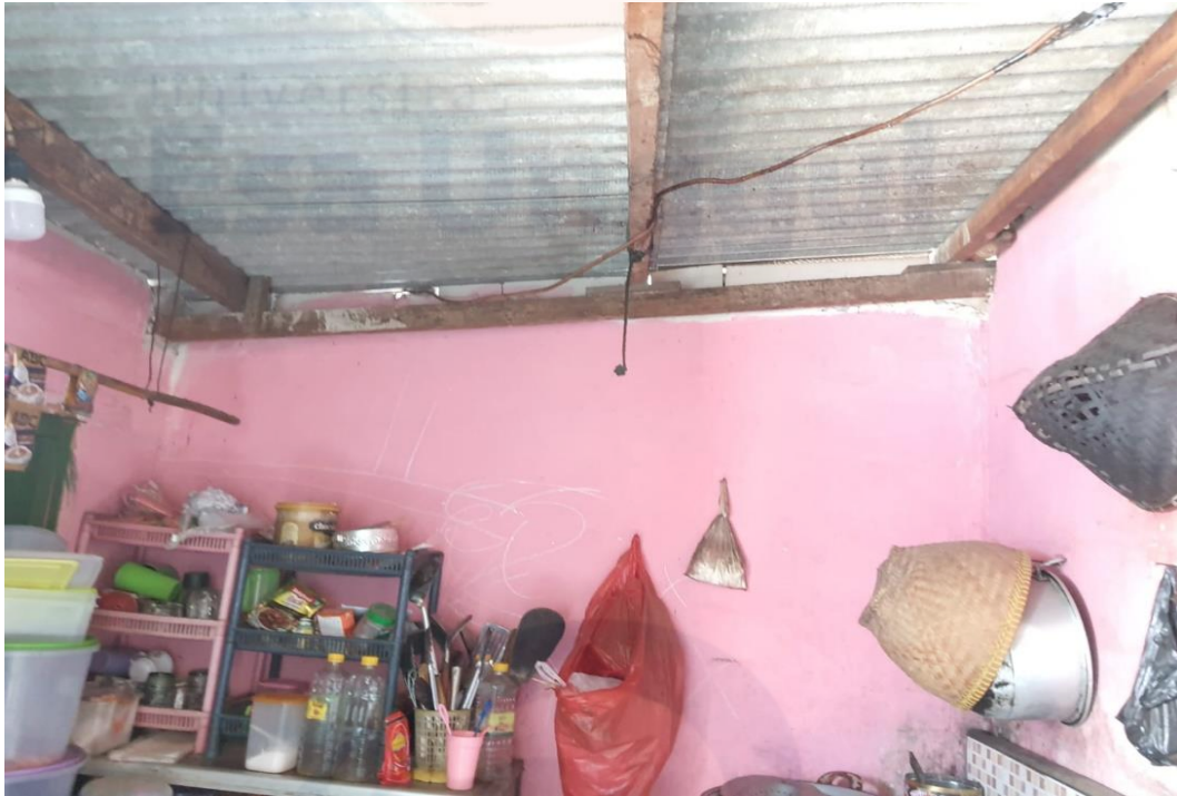
Kondisi Dapur Informan Utama 1