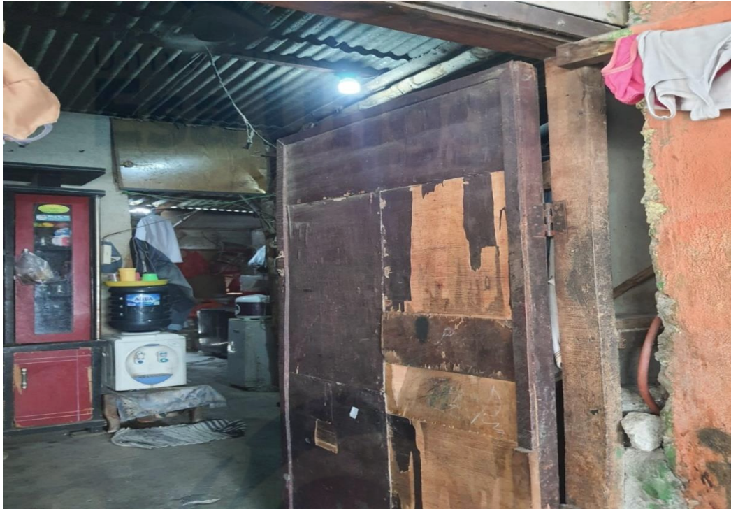
Kondisi rumah Informan Utama 2