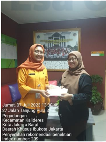
Jumat, 07 Juli 2023 13:30:45 27 Jalan Tanjung Pura 3 Pegadungan Kecamatan Kalideres Kota Jakarta Barat Daerah Khusus Ibukota Jakarta Penyerahan rekomendasi penelitian Index number: 209