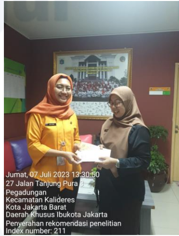
Jumat, 07 Juli 2023 13:30:50 27 Jalan Tanjung Pura 3 Pegadungan Kecamatan Kalideres Kota Jakarta Barat Daerah Khusus Ibukota Jakarta Penyerahan rekomendasi penelitian Index number: 211