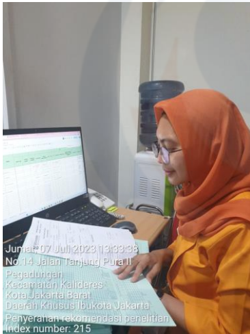
Jumat, 07 Juli 2023 13:33:38 No.14 Jalan Tanjung Pura II Pegadungan Kecamatan Kalideres Kota Jakarta Barat Daerah Khusus Ibukota Jakarta Penyerahan rekomendasi penelitian Index number: 215