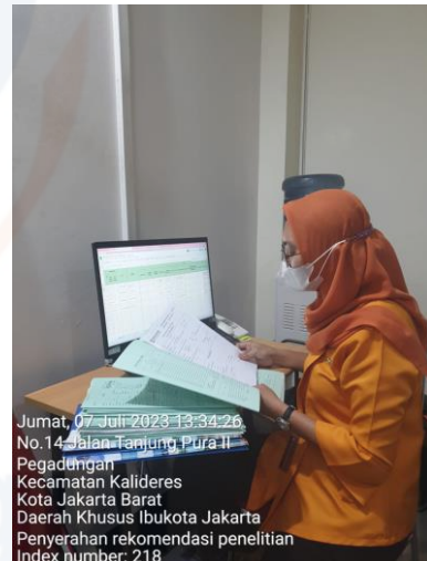
Jumat, 07 Juli 2023 13:34:26 No.14 Jalan Tanjung Pura II Pegadungan Kecamatan Kalideres Kota Jakarta Barat Daerah Khusus Ibukota Jakarta Penyerahan rekomendasi penelitian Index number: 218