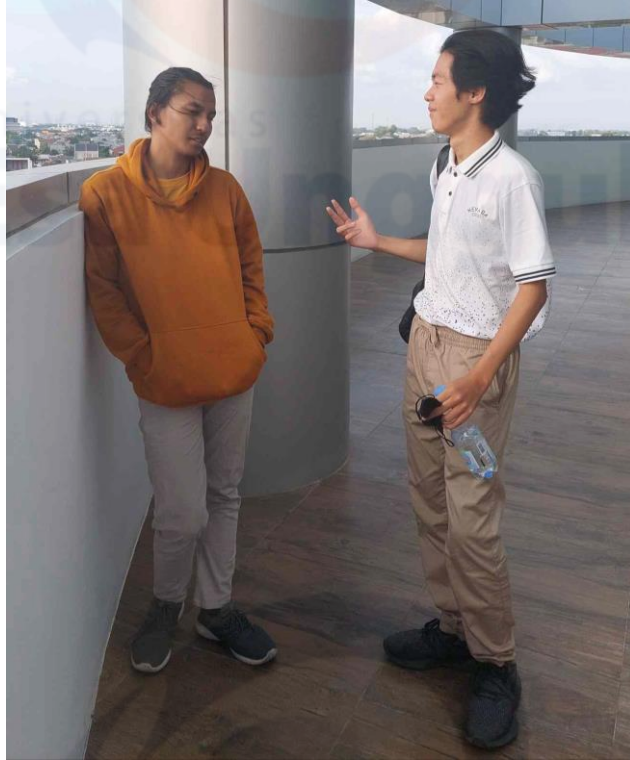
Lampiran Wawancara 1.3