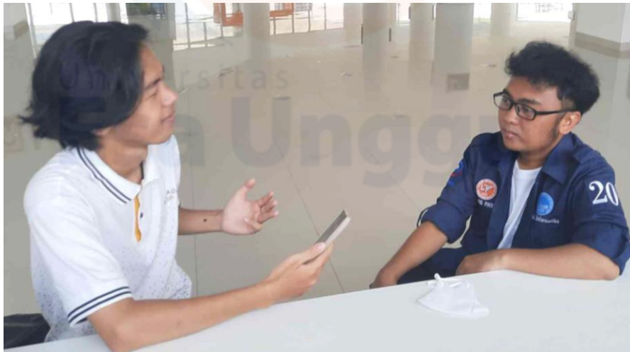
Lampiran Wawancara 1.5