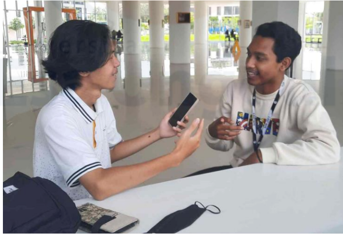
Lampiran Wawancara 1.4