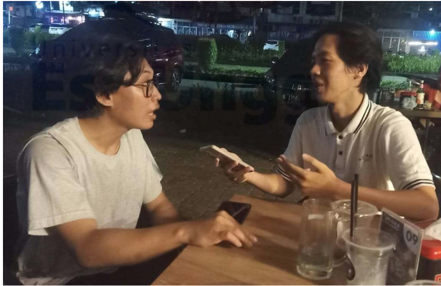
Lampiran Wawancara 1.2