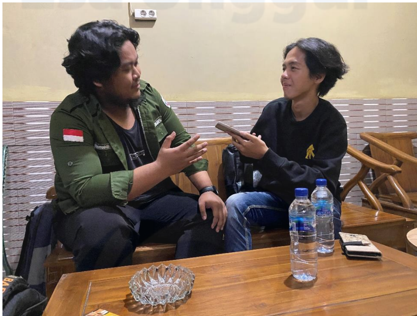
Lampiran Wawancara 1.1