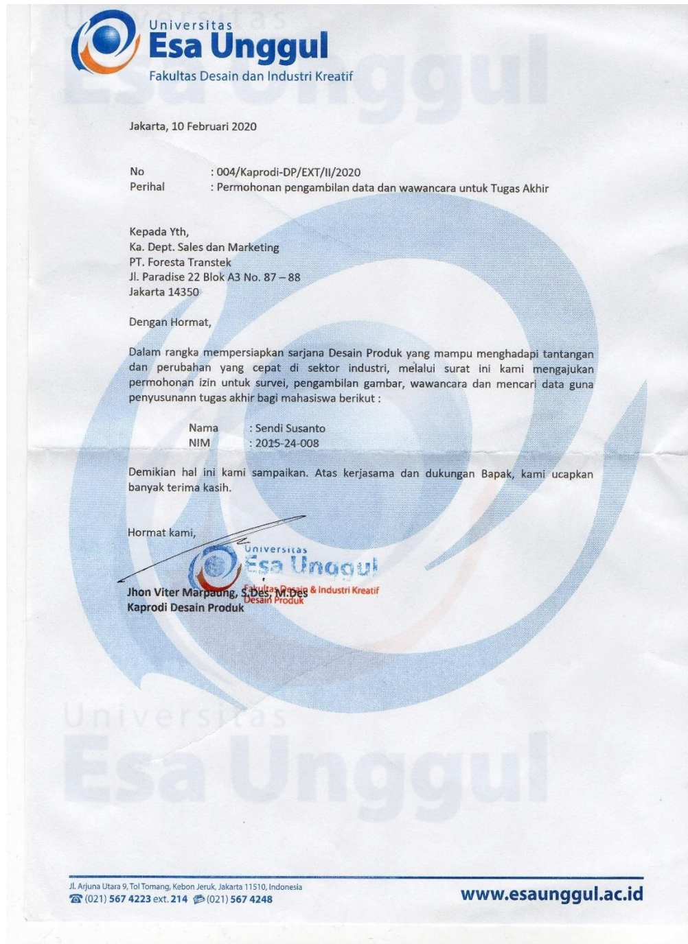
Gambar 6.52 Surat Pengantar Riset Lapangan untuk PT. Foresta Transtek.