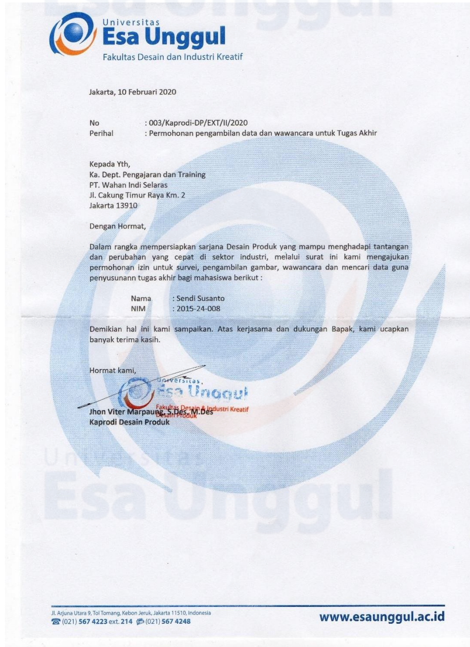
Gambar 6.49 Surat Pengantar Riset Lapangan untuk PT. Wahana Inti Selaras.