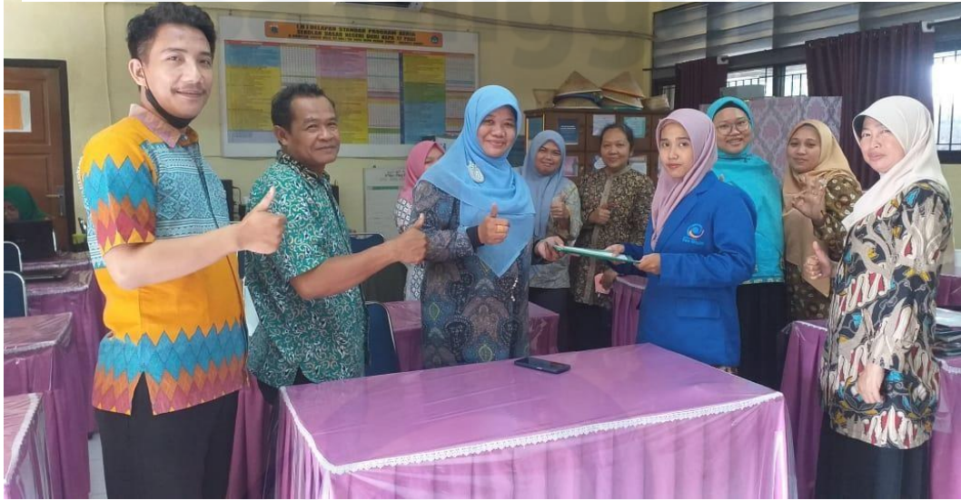
Lampiran 2 Foto