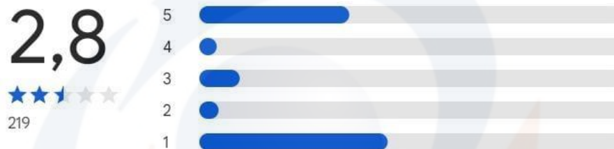
Gambar 1. 1 Rating Aplikasi Tangerang Gemilang ( https://play.google.com/store/apps/details?id=go.id.tangerangkab.gemilang )

Rating dan ulasan diverifikasi dan berasal dari orang yang menggunakan jenis perangkat yang sama dengan yang Anda gunakan ⓘ