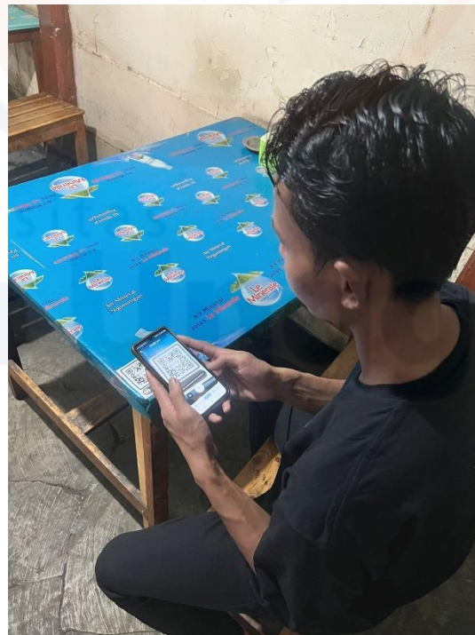
Gambar Mengscan Barcode