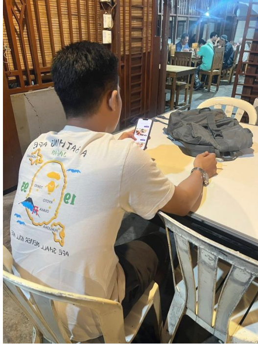
Gambar Memesan Makanan