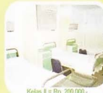
Kelas II = Rp. 200.000,-