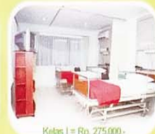
Kelas I = Rp. 275.000,-