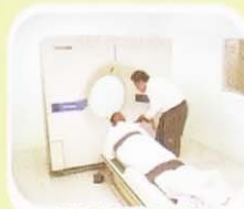
RADIOLOGI, CT SCAN