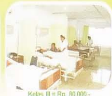
Kelas III = Rp. 80.000,-