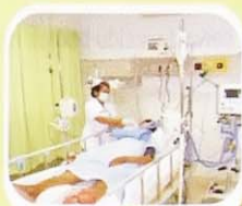
Perawatan ICU & ICCU