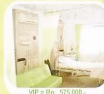
VIP = Rp. 575.000,-