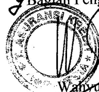
Wahyu Wisambada Kepala

PT (Persero) Asuransi Kredit Indonesia Bagian Pengembangan SDM