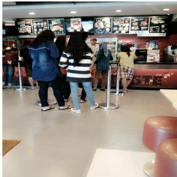
Tempat Pelayanan pelanggan atau Kasir