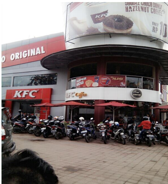
Parkir KFC Taman Semanan Indah Cengkareng