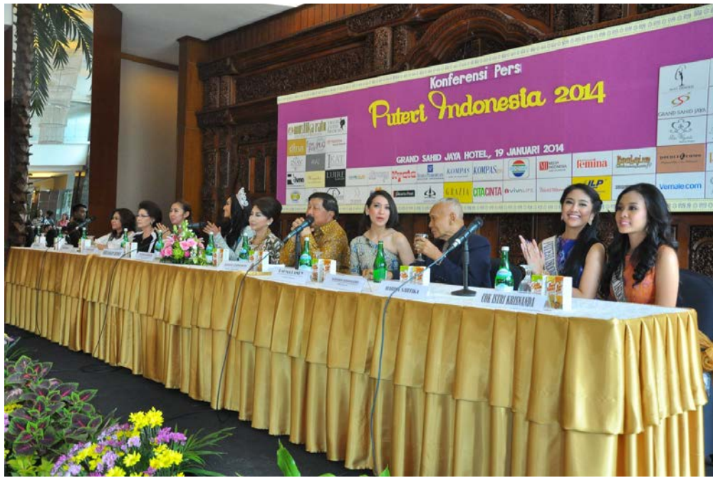
19 Januari 2014 | Konferensi Pers Puteri Indonesia 2014