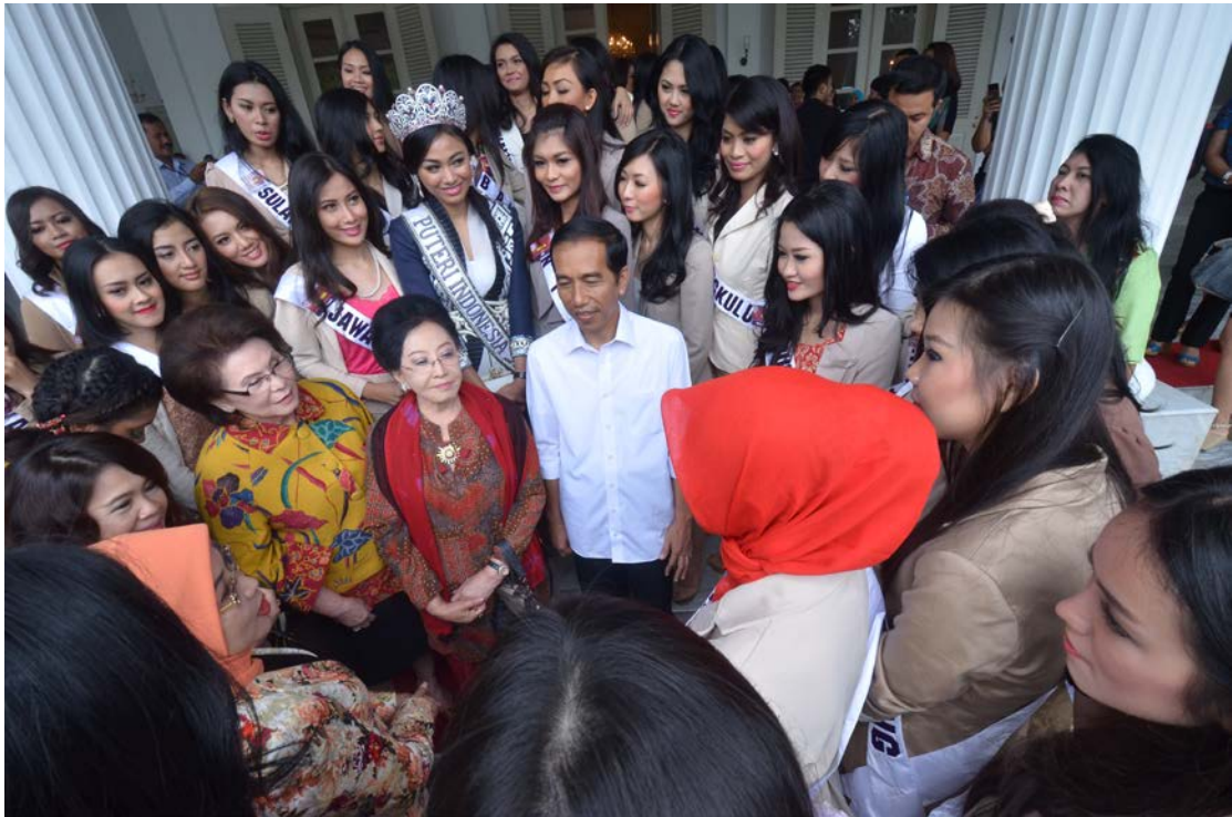
23 Januari 2014 | Kunjungan Finalis Puteri Indonesia 2014 ke Kantor Gubernur DKI Jakarta