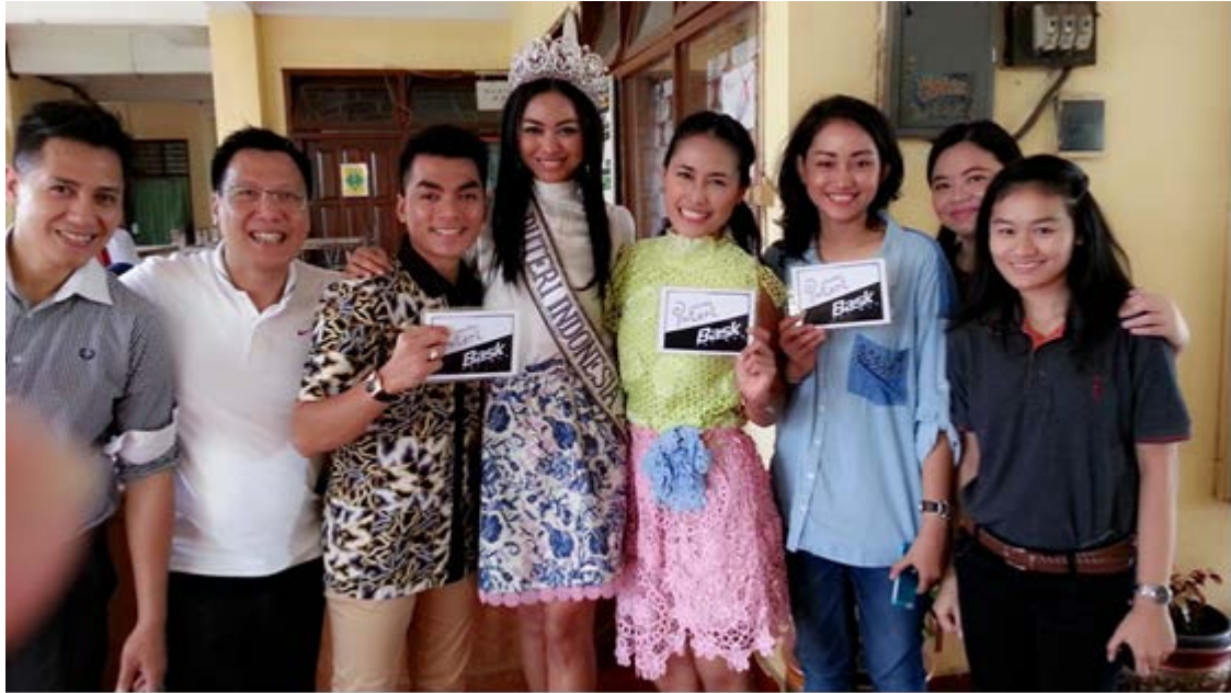
Kegiatan Soft Launching Puteri 7 Bask di Pensi Hysterivo SMPN 3 Depok 19 Desember 2013