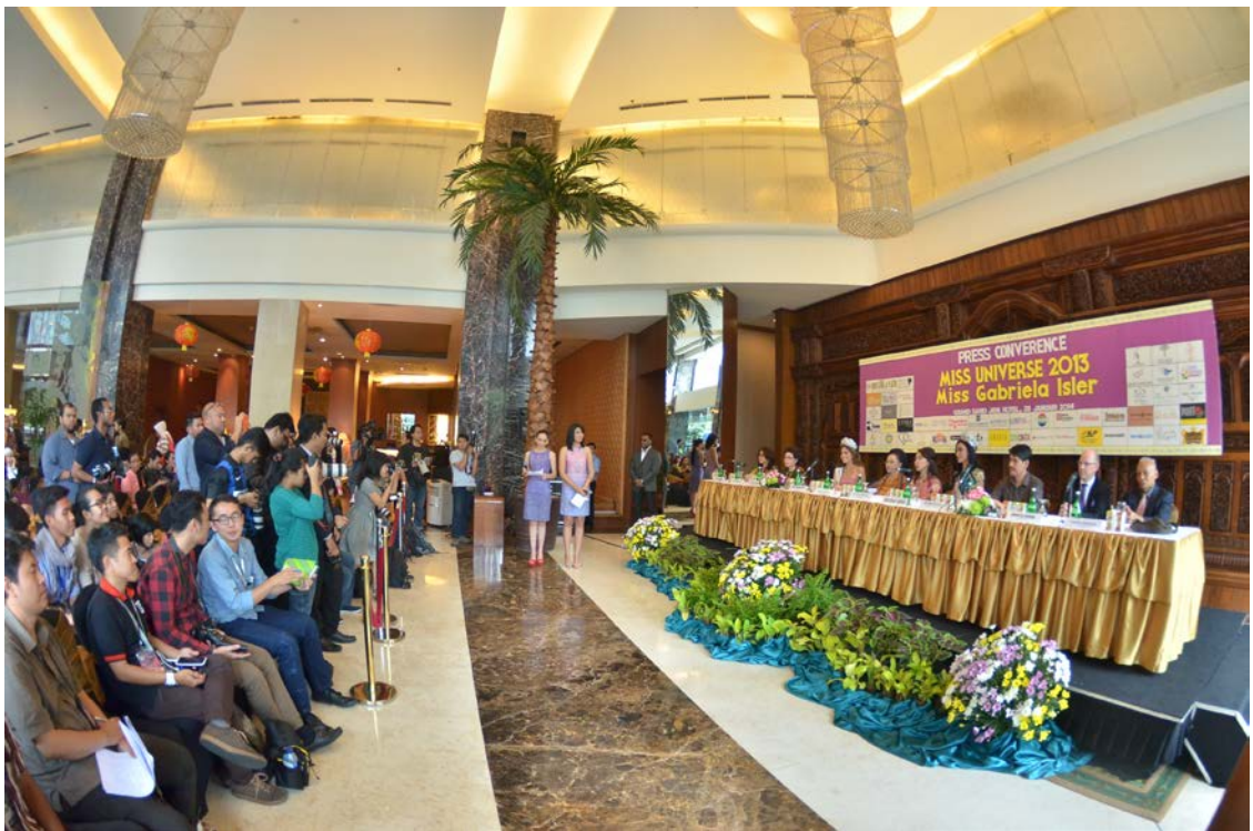
28 Januari 2014 | Konferensi Pers Miss Universe 2013