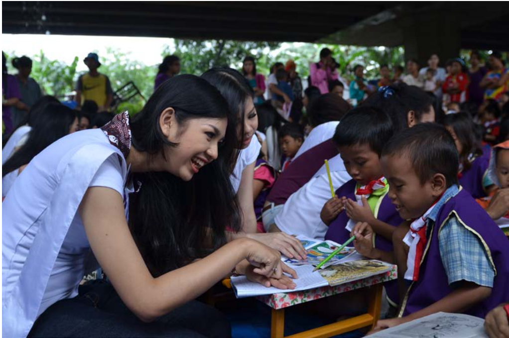
21 Januari 2014 | Kunjungan Sosial Finalis Puteri Indonesia 2014