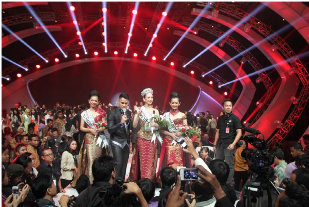
Suasana Konferensi Pers Grand Final PPI 2014