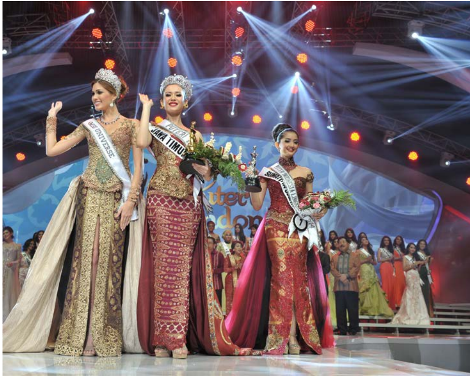
29 Januari 2014 | Grand Final Puteri Indonesia 2014