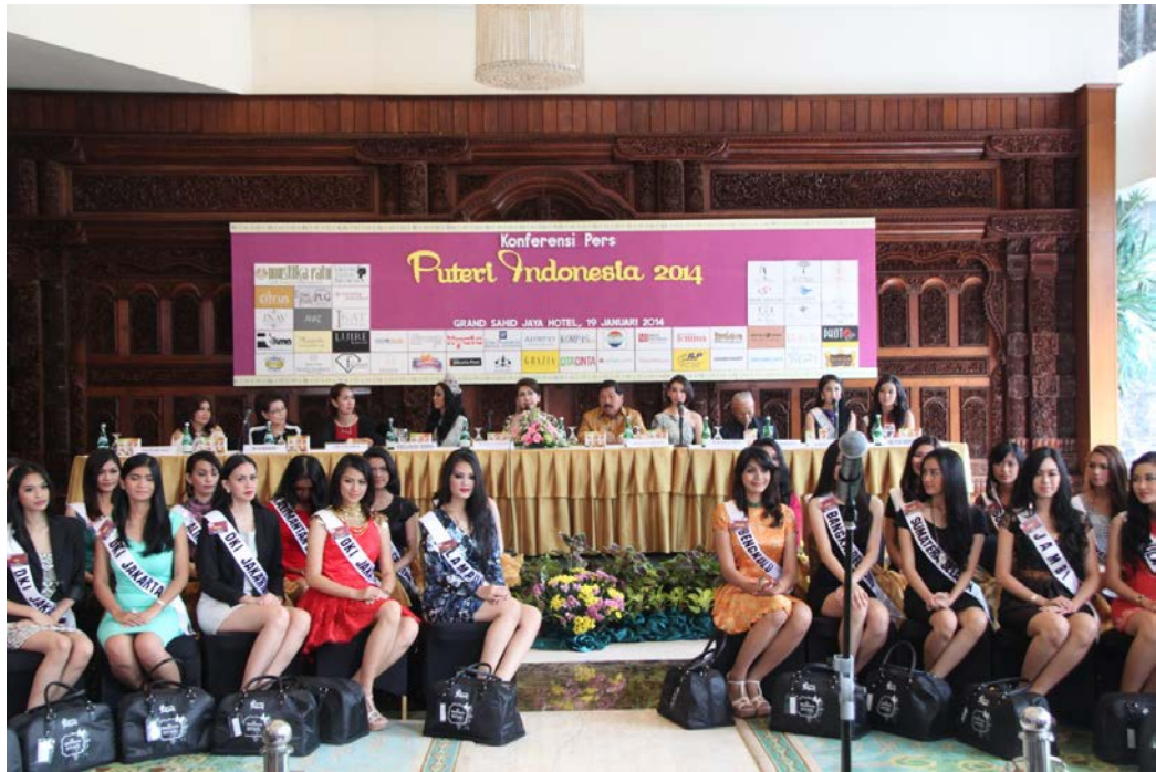
19 Januari 2014 | Para Finalis Puteri Indonesia 2014 saat Konferensi Pers