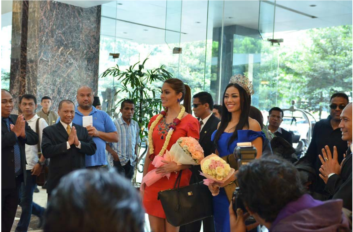
27 Januari 2014 | Kedatangan Miss Uninerse 2013 Maria Gabriela Isler