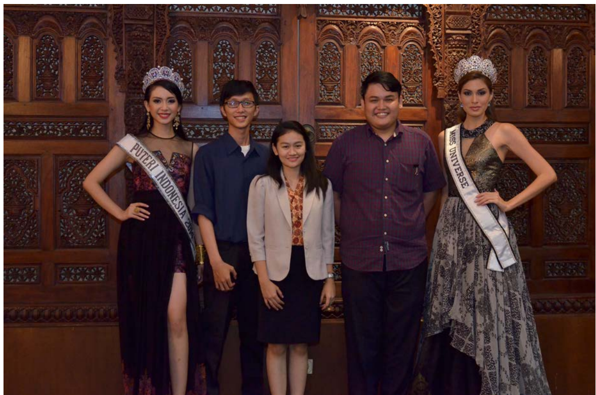
Gala Dinner With Puteri Indonesia 2014 & Miss Universe 2013