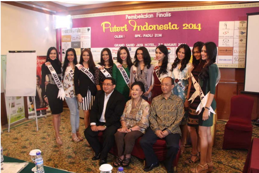
26 Januari 2014 | Pembekalan Politis Fadli Zon