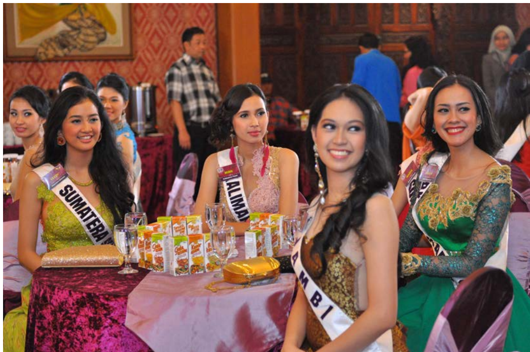
20 Januari 2014 | Gala Dinner Finalis Puteri Indonesia 2014 di Mangunsarkoro