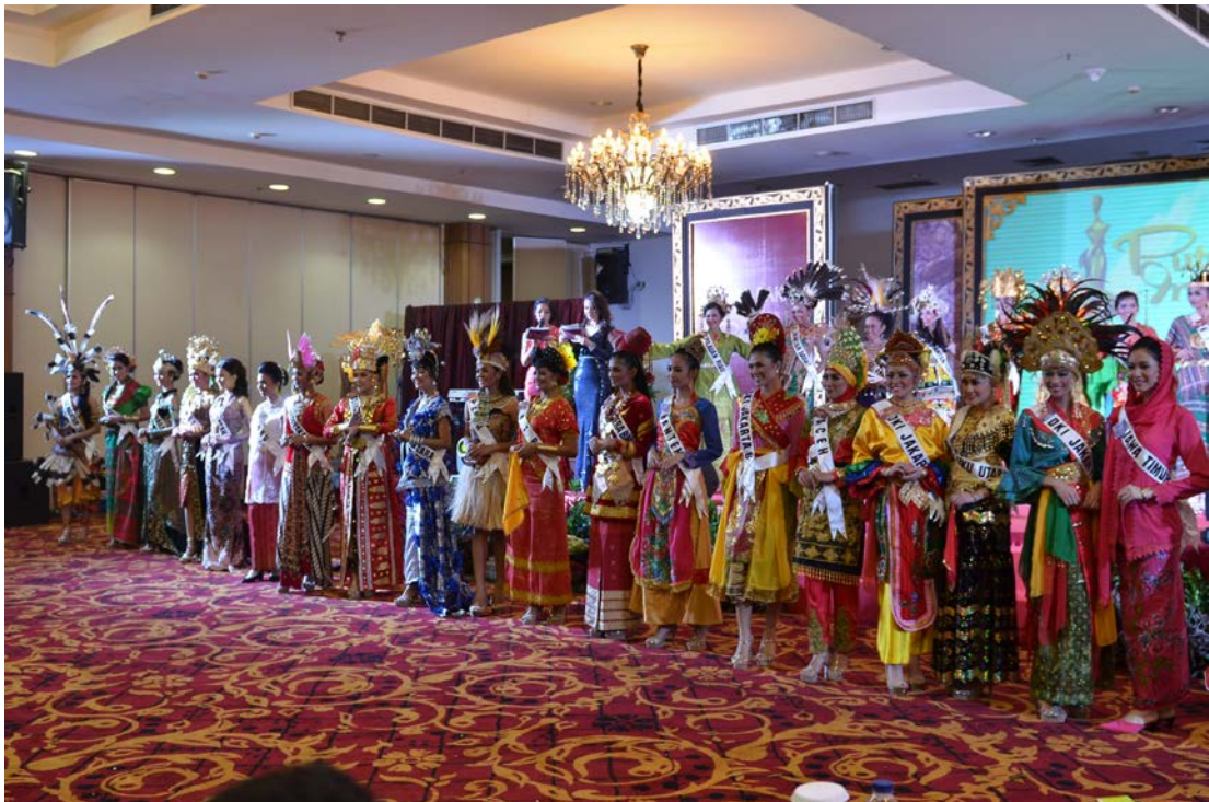
24 Januari 2014 | Malam Bakat atau Malam Budaya