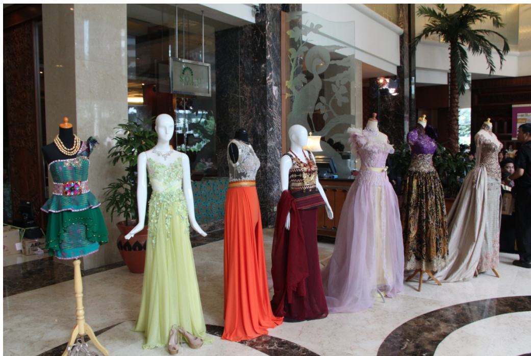
Display Gaun Karya Desainer Indonesia saat Konferensi Pers PI 2014, 19-01-2014